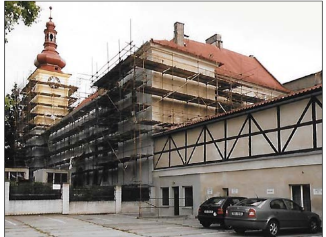
Obr. 9. Oprava budovy zámku, sídla administrativy podniku

západoevropské cukrovary. Dařilo se investovat, modernizovat a zvyšovat zpracovatelskou kapacitu, která nahrazovala kapacity zpracování řepy uzavíraných cukrovarů. Postupně byla opět s použitím nakoupeného zařízení z druhé ruky ze západoevropských cukrovarů rekonstruována odpařovací stanice, varny cukru, zabudovány další plynové kotle české výroby. Stávající extraktor DDS byl nahrazen druhým extraktorem RT, byla vybudována sušárna řepných řízků s výrobou sušených granulí (krmivo). Bylo postaveno další silo na 30 tis. t cukru, instalovány řezačky řepy Maguin a BMA, byla zvětšena a zdokonalena filtrace šťáv, zabudována nová změkčovací stanice cukerních šťáv, ČOV atd. V kampani 2003 jsme tak měli instalovanou kapacitu zpracování řepy v Dobrovici 11 tis. t řepy za den.