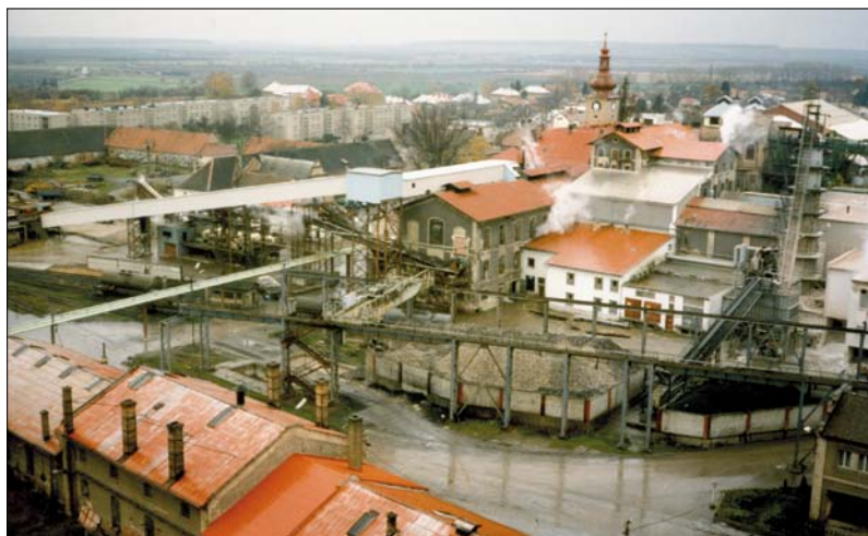
Obr. 1. Cukrovar v Dobrovici na začátku devadesátých let