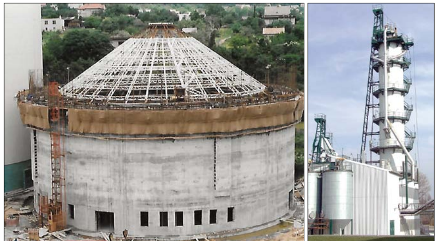
Obr. 10. Výstavba sila na 30 tis. t cukru (1996); nová dobrovická vápenka

Investice však nesměřovaly jen do cukrovaru. Se stoupající výkonností závodu jsme začali mít problémy s ekologickými dopady našeho hospodaření na město, jeho obyvatele a okolí. Jednalo se zejména o hluk, dopravu, prašnost a zápach. Každý rok tak musela být z celkových investic vyčleněna částka na řešení problémů životního prostředí. Nahrazovali jsme hlučná zařízení tiššími, zhotovovali jsme protihlukové stěny, vybudovali dva silniční obchvaty za 180 mil. Kč odvádějící automobily s řepou mimo městskou zástavbu a okolní obce, zpevnili jsme prašné plochy a zabudovali lapače prachu a odstraňovali zápach.