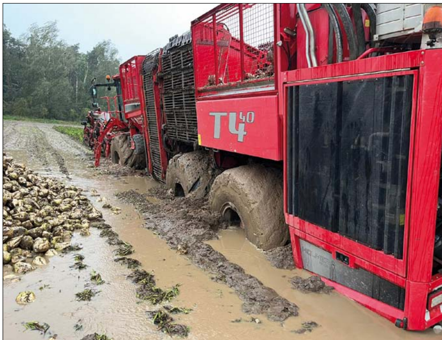
Obr. 3. Těžké podmínky sklizně a nakládky řepy v druhé polovině září

nahradila fyzicky opotřebené a morálně zastaralé difuze RT. Obě investiční akce přispěly významnou měrou k vynikajícím kampaňovým výsledkům. Zpracovávaná řepa v první polovině kampaně poskytla šťávy odpovídající polarizace, zároveň však vysoké čistoty, dobrých barev a tvrdostí. Vysoká výtěžnost výroby krystalického cukru a jeho kvalita byla v obou cukrovarech. V závodě Dobrovice se díky instalovaným difuzím – extrakčním věžím dařilo držet nízké odtahy s velmi pozitivním dopadem na spotřebu primárního paliva ve výši úspory 5 % meziročně. Rovněž tak provoz sušárny řízků těžil z nově instalované technologie extrakce cukru a došlo k výraznému zvýšení sušiny řízků. Od prosince bylo pozorováno zhoršení kvality šťáv, snižoval se kvocient čistoty a rostly tvrdosti. Rok 2024/2025 je možné hodnotit v cukrovarech společnosti Tereos TTD, a. s., nakonec jako rok s nadprůměrnými výsledky ve všech oblastech. Celkem Tereos TTD, a. s., vyrobila rekordních 371 tis. t cukru.