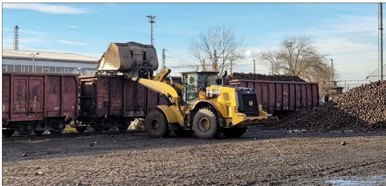
Obr. 7. Železniční přeprava cukrové řepy ke zpracování v cukrovaru Hrušovany nad Jevišovkou

východních Čech a západního Slovenska. Tato přeprava je organizována tak, aby část denního objemu zpracované cukrové řepy tvořily dva vlaky s celkovým objemem 2 400 t. Zpracování cukrovky bylo v Hrušovanech ukončeno 3. února 2025 a dovážka cukru ve středu 5. února 2025.