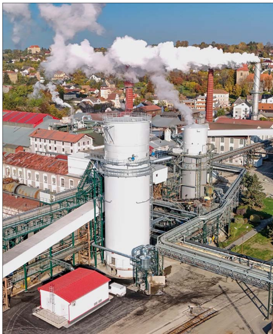
Obr. 6. Část areálu dobrovického cukrovaru v kampani, v popředí nový extraktor BMA