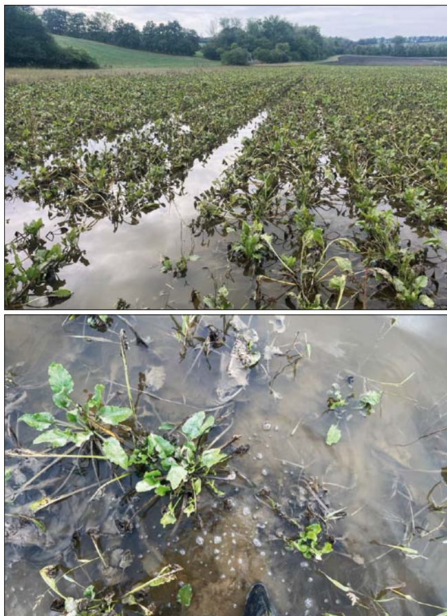
Obr. 6. Zaplavené plochy cukrové řepy na Uherskohradištsku

východních Čech a západního Slovenska. Tato přeprava je organizována tak, aby část denního objemu zpracované cukrové řepy tvořily dva vlaky s celkovým objemem 2 400 t. Zpracování cukrovky bylo v Hrušovanech ukončeno 3. února 2025 a dovážka cukru ve středu 5. února 2025.