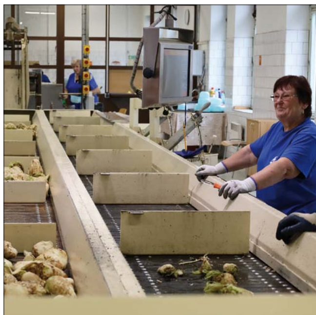
Obr. 2. Vzorkování nakoupené cukrovky v Dobrovice

Průběh vegetace neměl vážné výkyvy. Pravidelné dešťové srážky byly rozprostřeny téměř po celém pěstitelském rajónu. Pouze některé oblasti, zejména pak mezi Brandýsem nad Labem a Českým Brodem byly postiženy horším přídelem srážek, který negativně ovlivnil výši výnosů. Konec srpna a první dva týdny září s tropickými teplotami ve dne i v noci vegetaci cukrové řepy rozhodně neprospěly. Během tropických nocí řepa cukr místo ukládání prodýchala a výsledky čtvrtého vzorkování nás nepříjemně překvapily. Odhad výnosu na základě provedených vzorkování učiněný v polovině září byl poměrně přesný (obr. 1.). Dešťové srážky v polovině září dosahovaly v některých oblastech v úhrnu tři dnu až přes 200 mm, což se také významně podepsalo na sklizni a dalším vývoji cukrové řepy. Výsledkem těchto vlivů byla nízká cukernatost v průběhu celé 147 dnů dlouhé kampaně v Tereos TTD, a. s. (obr. 2.). Průměrné zahlinění dodávané řepy bylo nakonec na průměrné úrovni, přestože počátek kampaně 2024/2025 byl vzhledem k vysokému přídele dešťových srážek komplikovaný (obr. 3.).