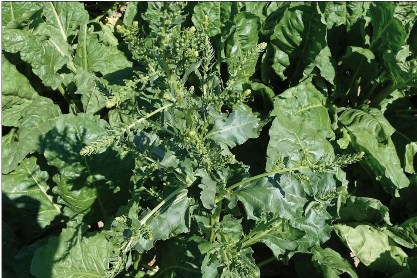
Obr. 5. Vyběhlíce a vykvetlice je třeba z porostu Conviso Smart cukrové řepy včas odstraňovat, aby se zabránilo zaplevelení rezistentními populacemi plevelných řep

Vedle již uvedených problémů s rezistentními populacemi plevelů je třeba maximálně eliminovat riziko vývoje rezistence u plevelných řep. Pěstitelé Smart odrůd jsou sice smluvně vázáni odstraňovat vyběhlíce a vykvetlice (obr. 5.) ze svých porostů, aby nemohlo dojít ke sprášení s populacemi plevelných řep rostoucích v okolních porostech konvenčních řep nebo aby se tyto herbicidně odolní jedinci nemohli na pozemku reprodukovat. Realita v praxi však bývá taková, že se nepodaří řadu vyběhlíc včas zlikvidovat, což se může ve velmi krátké budoucnosti projevit jako „časovaná bomba“ která povede k tomu, že na těchto pozemcích nebude kvůli zamoření rezistentní plevelnou řepou možné pěstovat cukrovou řepu (včetně Smart odrůd) a regulace plevelných řep v ostatních plodinách bude náročná a nákladná.