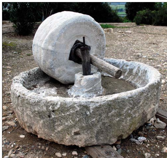
Obr. 5. Středověký třtinový mlýn z Kypru (41)

Třtinový cukr ve středověké Evropě reprezentoval sladkou chuť ve své nejvýraznější podobě. Navíc byl spojen s exotickými východními zeměmi, lidé si ve středověkých městech jeho výrobu