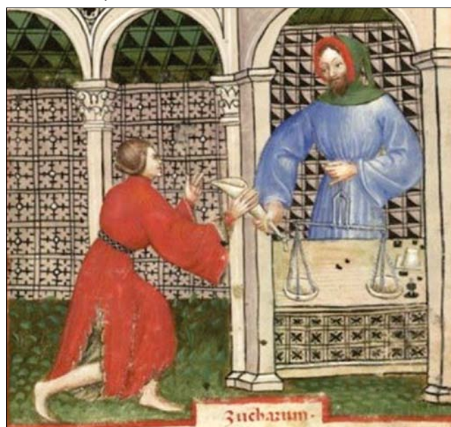
Obr. 9. Prodej cukru v kornoutu na středověké iluminaci