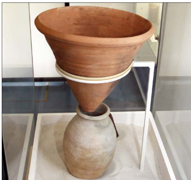
Obr. 7. Historická hliněná forma na cukr s odkapávací nádobou