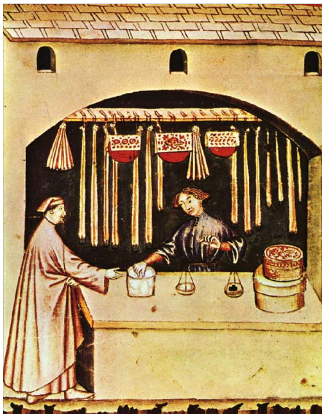
Obr. 2. Prodej cukru, ilustrace z knihy Tacuinum Sanitatis , 14. stol.

Británii v 17. století byla roční spotřeba cukru na osobu zhruba 1 kg, oproti dnešním více než 50 kg (10).