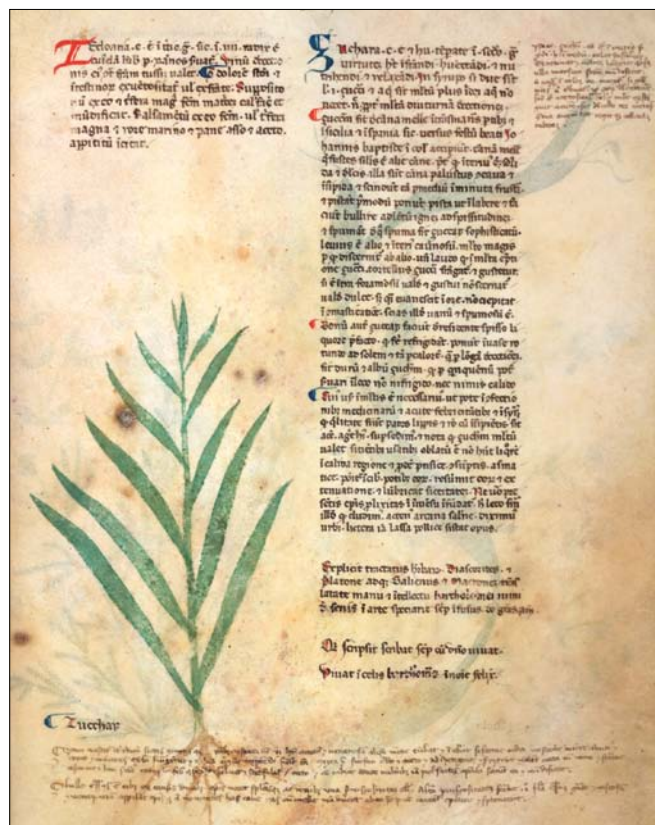
Obr. 8. Ilustrace cukrové třtiny ve sbírce lékařských textů, Itálie, zhruba z let 1280–1350