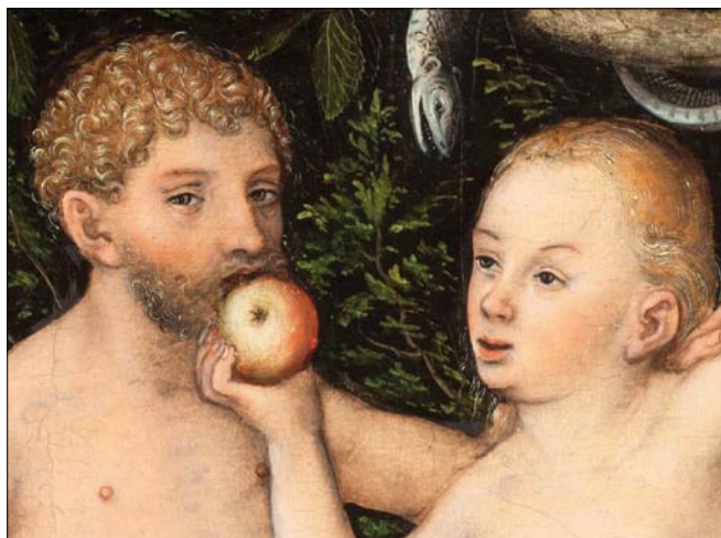
Obr. 1. Adam a Eva (Lucas Cranach st., výřez z obrazu)

V kombinaci s chutí se cukr (či obecně sladká chuť) stal předmětem řady rozdílných názorů, jaký je vliv sladkého na lidské chování. Vztah ke sladké chuti byl ve středověké tradiční společnosti ovlivněn ranou křesťanskou doktrínou nejednotný. Sladké vzbuzovalo nejednoznačné reakce. Na jedné straně byla duševní sladkost popisovaná v biblických textech symbolicky jako požitek z víry, na druhé straně fyzická sladkost jídla přinášela výjimečný chuťový zážitek, který měl pro tehdejší věřící symbolickou podobu něčeho opojného, které se nesmí nadužívat. Přenesení cukru na chování přešla v alegorické podobě do řady přísloví, které tuto nejednoznačnost ukazují. Protože je vlastností cukru, že se rozpustí ve vodě, tak „být z cukru“ znamenalo „slabost ducha“ či „být slabochem“. Naopak přísloví „mít srdce z cukru“ mělo význam „mít srdce plné něhy“. Obecně označit někoho, že je sladký, znamená řadu dvojznačností.