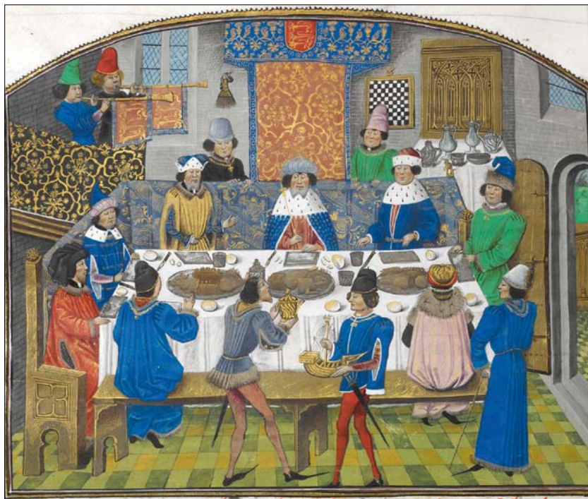
Obr. 6. Středověká hostina s cukrovými subtilty (40)

Sladká chuť získávala na větší důležitosti, některá zelenina (např. hrách) se měla pěstovat právě kvůli sladké chuti. Zpočátku se cukr používal podobně jako další vzácná východní koření jen v malém množství především kvůli ceně a dostupnosti. V rámci tehdejší medicíny se některé potraviny, vedle cukru to bylo například víno, sůl či různé pryskyřice, považovaly za ochranu proti hnilobě. Zde se lékařství snoubilo s kuchařstvím, protože panovala představa, že stejný princip platí při přípravě jídel. Látky, které konzervovaly potraviny, měly být účinným lékem proti „zkažení“ lidského těla. Pro středověkou dietetiku bylo také typické, že důvěřovala žádostem těla. Jestliže měl tedy konzument na něco chuť, měl to také jíst, protože podle názoru dobového lékaře žádost (hlad, žízeň, chuť) odrážela jeho oprávněnou biologickou potřebu (30).