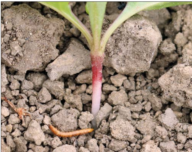
Obr. 3. Drátovci – larvy kovaříků škodí na klíčících a mladých rostlinách žírem na podzemních částech