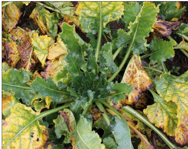
Obr. 11. Klíčové bude správnou ochranou zabránit přenosu virových žloutenek mšičí broskvoňovou

měly umožnit i nadále regulovat škůdce pod práh škodlivosti. Čím tedy nahradit moření neonikotinoidy?