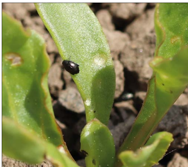
Obr. 1. Dospělci dřepčků vykusují do řepných rostlin dírky, nejvíce škodí na nejmladších rostlinách