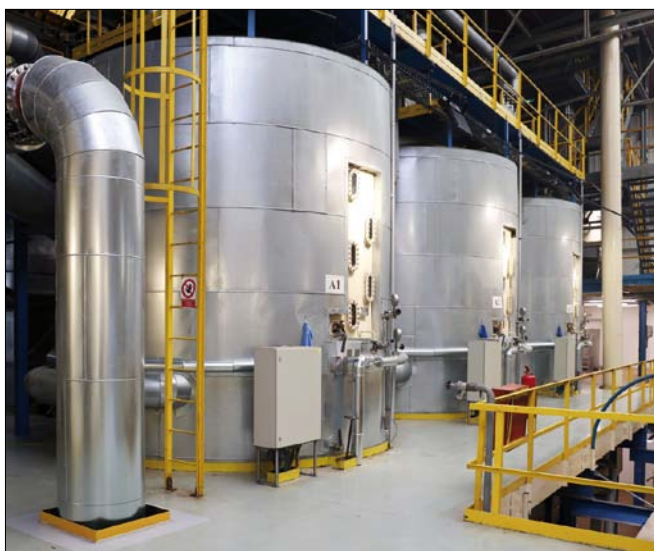
Obr. 4. Z varny cukrovaru (2023)