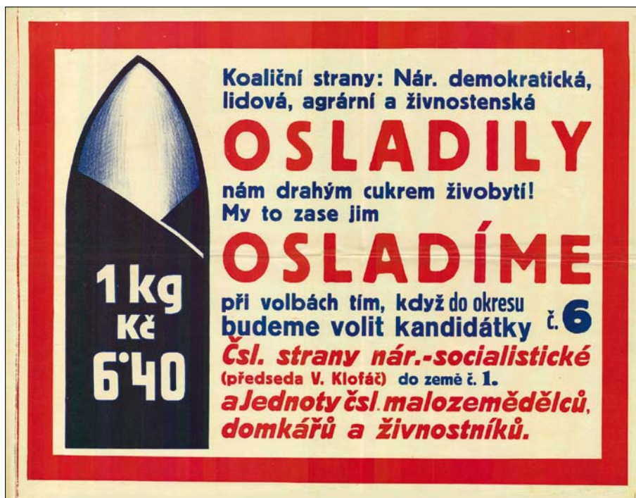
Obr. 4. Volební plakát koaličních stran: národně demokratické, lidové, agrární a živnostenské z roku 1935 – cukr jako nástroj politické kampaně.