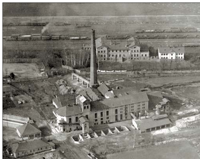
Obr. 2. Bývalý rolnický cukrovar ve Zdicích

jejichž majetkové podíly byly vázány na produkci cukrovky a byly tedy ve vlastnictví řepařů. Jednalo se zejména o rolnické akciové cukrovary (8). Již v roce 1862 byl zaznamenán neúspěšný pokus o založení obdobného cukrovaru v Knovízi. O rok později takový cukrovar vznikl v Lužici nad Vltavou a cukrovary tohoto typu postupně přibývaly (8).