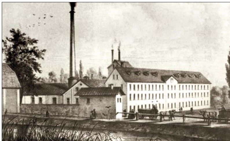
Cukrovar Třebovčice byl založen v roce 1851 jako součást velkostatku Cerekvice nad Bystřicí, jehož vlastníkem byl rod rytířů z Kleebornu.