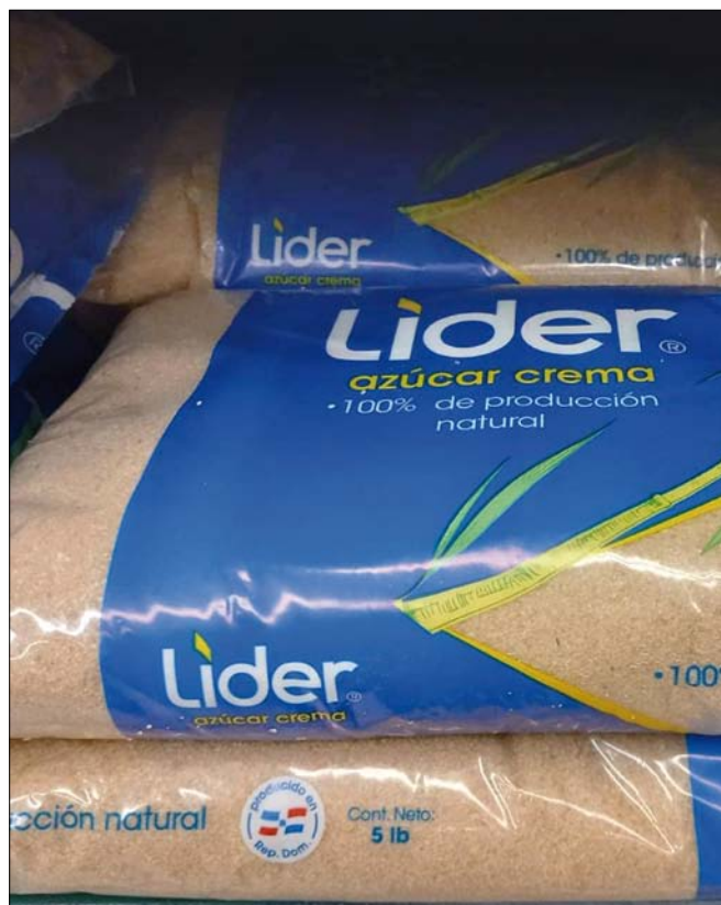
Obr. 6. Spotřebitelské balení přírodního třtinového cukru z Dominikánské republiky

které mají významný vliv na pěstování a zpracování cukrové třtiny a výroby cukru po roce 2000. V posledních letech Dominikánská republika ustupuje od monokulturního zemědělství, zaměřuje se i na kávu, kakao, tabák či banány. Podstatnou součástí Dominikánského hospodářství po roce 2000 je i cestovní ruch.