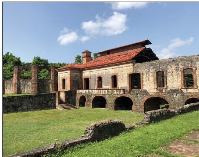
Obr. 2. Zbytky cukrovaru Boca de Nigua z 18. století, z vrcholu španělské éry v dnešní Dominikánské republice (10)

30 třtinových plantáží. „Cukrová revoluce“ se po čtyřech stoletích opakovala a těžiště hospodářského života se začalo vracet do Santo Dominga. Právě přes jeho přístav totiž směřovala většina exportovaného cukru (2).