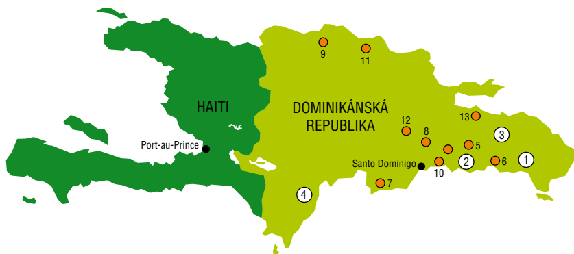
Obr. 4. Mapa cukrovarů v Dominikánské republice (10)

Cukrovarny (v závorce je rok založení): 1 – Central Romana – Central Romana Corporation (1918), 2 – Cristóbal Colón – CAEI (1883), 3 – Porvenir – CEA (1884), 4 – Barahona – CAC (1920); starší, dnes nepracující cukrovarny (mlýny): 5 – Consuelo (1881), 6 – Santa Fé (1885), 7 – CAEI (1893), 8 – Ozama (1895), 9 – Amistad (1899), 10 – Boca Chica (1916), 11 – Montellano (1918), 12 – Río Haina (1950), 13 – Pringamosa