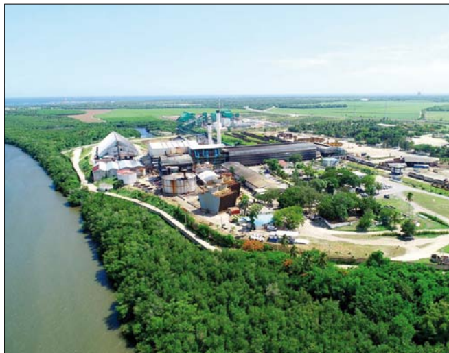
Obr. 3. Cukrovar Cristóbal Colón konzorcia CAEI

burzy v New Yorku, nikoli potřebám dominikánské společnosti. Rozmach cukrovarnictví přinesl nejen definitivní odlesnění jihu ostrova (a následné problémy s erozí), ale především zánik tradiční společnosti a do určité míry i likvidaci nezávislých rolníků (2). Produktivita modernizovaných cukrovarů prudce stoupala, ale produktivita sklizně ( zafra ) zůstávala stejná – jediným nástrojem byla mačeta. Mezi lednem a dubnem bylo tedy třeba na třtinových plantážích nárazově zaměstnat tisíce dělníků (často z Malých Antil a Portorika) (2).