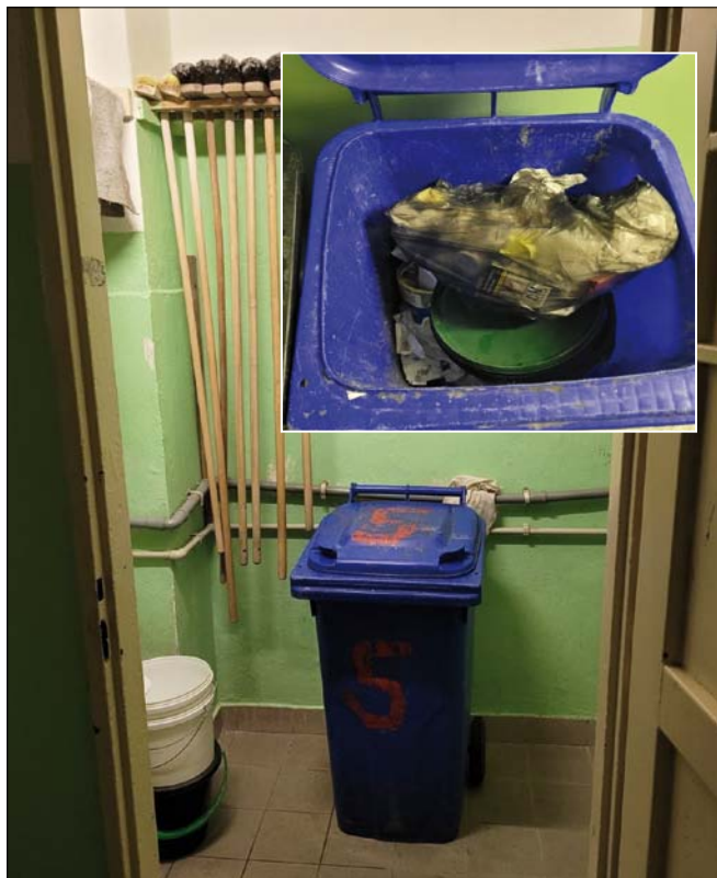
Obr. 3. Místo pro kvašení kvaku

Atraktivnost nápoje a případného alkoholového opojení, i přes vysokou pravděpodobnost kázeňského postihu, nutí vězněné osoby pro hledání stále nových receptur, vzhledem k omezené nabídce ingrediencí a hlavních komponentů. Problém však nastává v případech, kdy zanechaný kvasící nápoj nelze odvětrávat, protože by to vedlo k odhalení kontrabandu dozorcujícím personálem věznice. I proto se většinou kvasící směs objevuje mimo cely a ložnice odsouzených, protože samotný proces kvašení je výrazně aromatický, resp. velmi zapáchající. I přes všechna tato negativa jsou schopni vězni nápoj pozřít s tím, že v mnoha případech riskují poškození zdraví, či minimálně nevolnost a zvracení. Cukr se tak stává významnou komoditou při vězeňské „výrobě“ alkoholového nápoje.