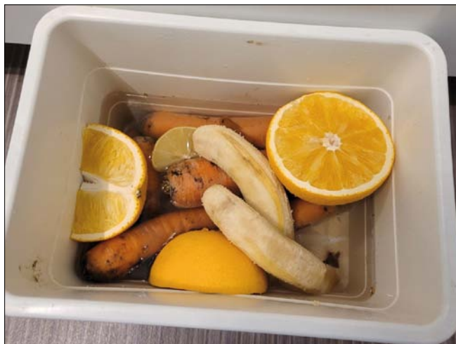
Obr. 2. Naložená směs pro výrobu kvaku

surovin v prostředí věznic, kdy jednotlivé ingredience jsou získány například v podobě potravin (ovoce, džusy, zelenina, cukr atd.) přidělovaných jako doplněk stravy, nebo si je odsouzení legálně zakoupí ve vězeňské prodejně v rámci řádných, tj. zákonných nákupů (obr. 2.). Samotný cukr sehrává v celé receptuře (a samotném procesu výroby) klíčovou roli. Pro jednu dávku je třeba přibližně dvou kilogramů cukru, což je poměrně velké množství.