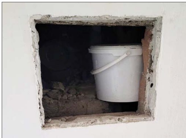
Obr. 5. Umístění nádoby s kvakem v šachtě (archiv autorů)

Další nelegální aktivita se týká samotné distribuce tohoto zakázaného nápoje, protože s ohledem na výkon trestu je jakýkoliv alkoholický nápoj zakázaný. Přesto ve věznicích dochází nejenom k odhalování kvaku jako polotovaru (naložené směsi), ale i k odhalování samotného nápoje, případně přímo k odhalení vězňů pod vlivem alkoholu. Ve věznicích také dochází k neustálému vylepšování receptur, k jejich předávání atp. (obr. 1.).