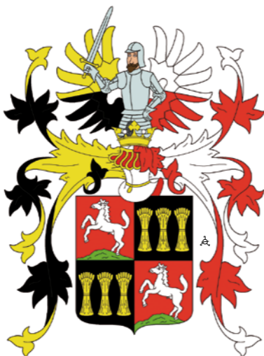
erb druhého zde zmíněného rodu