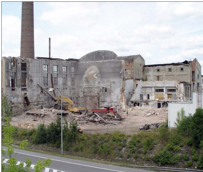
Obr. 7. Demolice objektu zrušeného slavkovského cukrovaru (2003)

Slavkovský cukrovar v průběhu své historie postupně měnil firemní název takto: