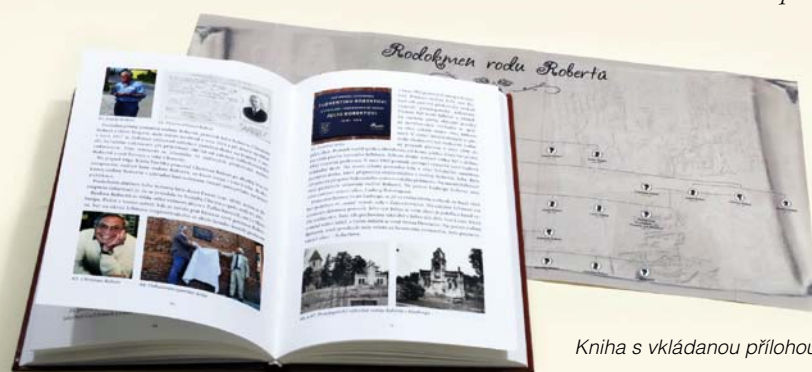
Kniha s vkládanou přílohou