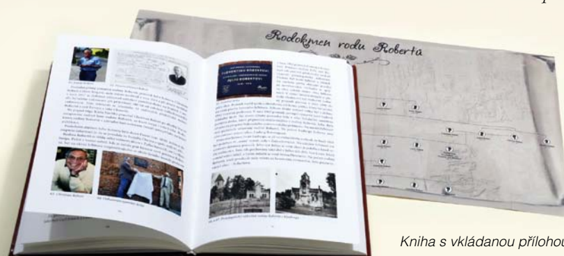
Kniha s vkládanou přílohou