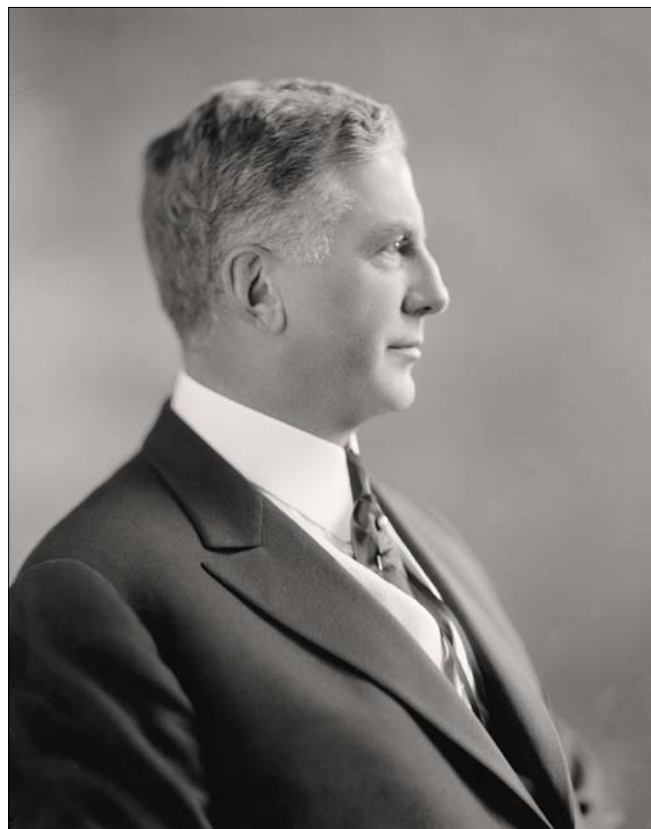
Thomas Lincoln Chadbourne (1871–1938), americký právník

zvýšení spotřeby mlékárenských produktů a ovoce (3a). Ústředí československých hospodyň sdružovalo na 30 000 členek, jednalo se tedy o skupinu, která byla nepřímo spojená s nemalým počtem obyvatel, neboť daný spolek byl zjevně spojen s celými rodinami. Žádost zněla takto: „ Přicházíme se svou žádostí právě nyní, kdy mezinárodní cukerní dohodou je vytvořena situace, která, bude-li správně pojata, může znamenati prospěch cukrovarům i spotřebitelům. Znamená-li omezení vývozu na jedné straně úsporu, tím, že nebude třeba tolik dopláceti na náš vývoz cukru, představuje na druhé straně citelné omezení výroby našich cukrovarů. Je v zájmu celého našeho státu, aby se tu našlo správné východisko, které spočívá, podle našeho pevného přesvědčení, ve zvýšení domácího konsumu cukru. “ (3b)