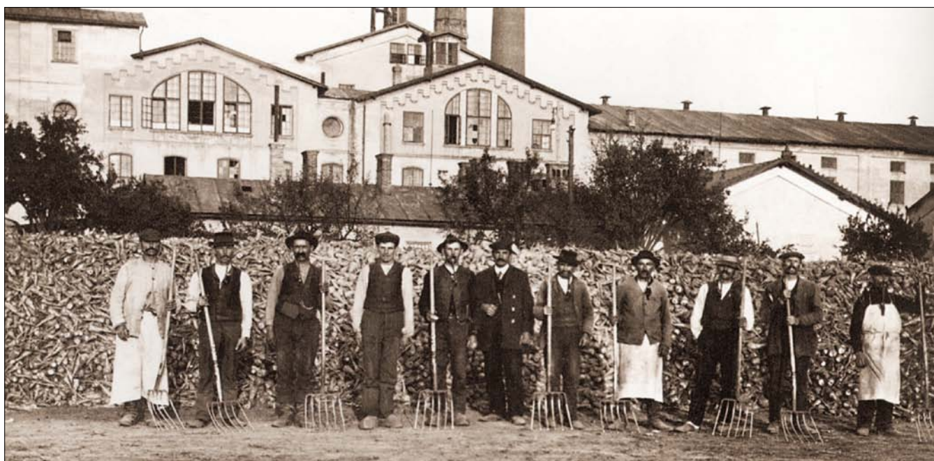
Manipulační dělníci na řepném dvoře cukrovaru ve Štětí