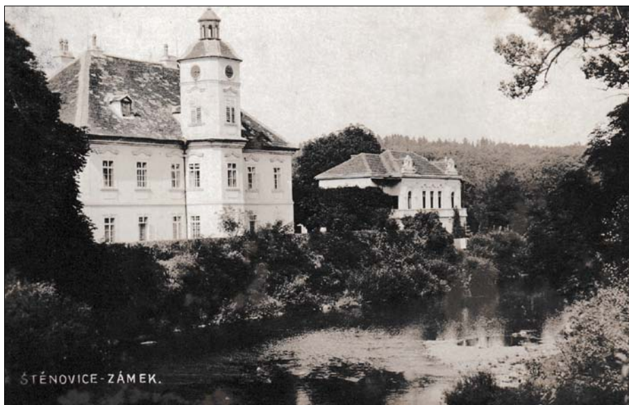
Obr. 5. Zámek ve Štěnovicích nedaleko Plzně