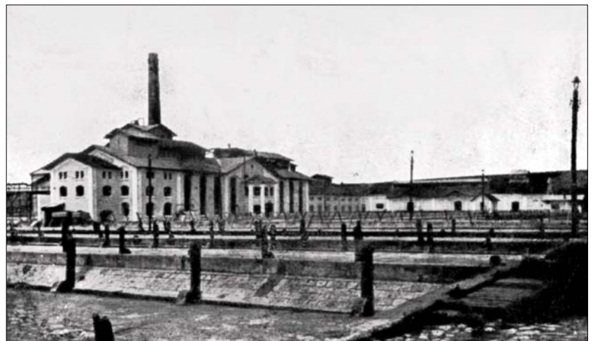
Obr. 2. Rolnický cukrovar v Dřevohosticích