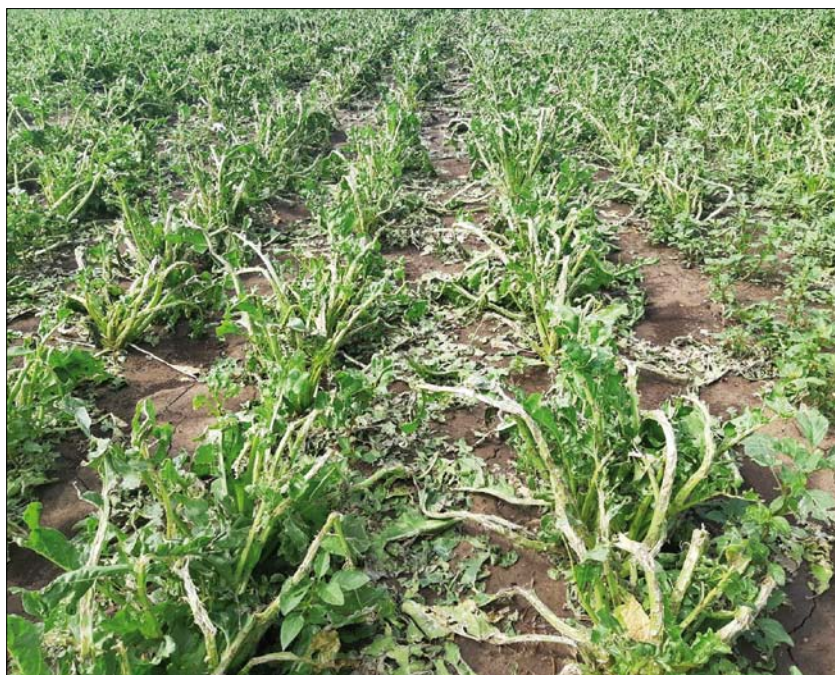
Obr. 1. Porost cukrové řepy poškozený kroupami

Součástí celého řetězce je i logistika cukru. Přeprava poměrně velkých objemů v kampani mezi sily a sklady představuje tlak na dopravní firmy, které se potýkají s nedostatkem řidičů a také s neočekávaným, a doufejme i pouze přechodným, nedostatkem náhradních dílů a nových aut.