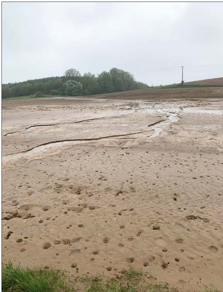
Obr. 2. Vodní eroze na poli s cukrovou řepou po přívalovém lijáku v Osoblaze na jaře 2021

pěstování cukrové řepy se znovu dostanou na důstojné místo, kam bezesporu historicky patří. Přeji všem úspěšnou kampaň 2021/2022.