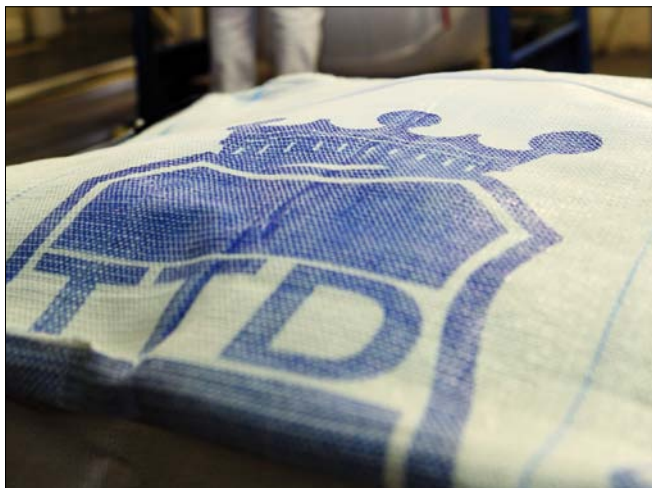
Obr. 1. Značka TTD je spjata s Dobrovincí od počátků cukrovaru