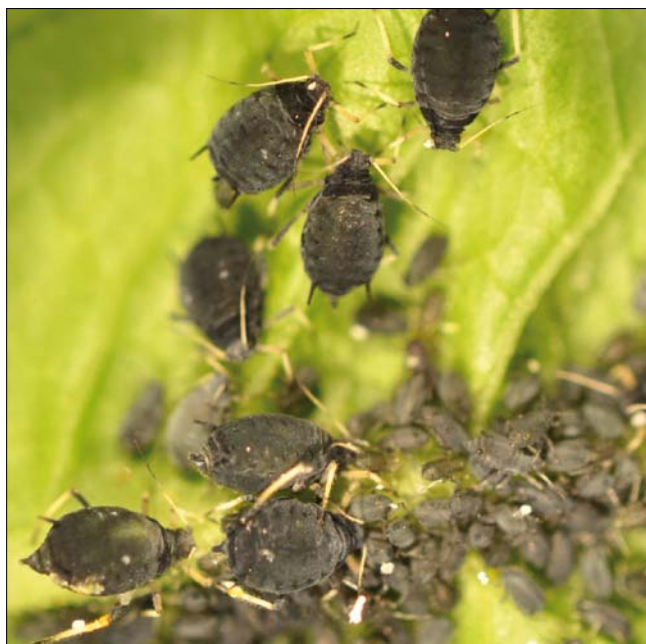
Obr. 3. Kolonie mšice makové na cukrovce

Škůdci nastupující těsně po vzejití představují jen první fázi ohrožení. Následuje květilka řepná, na kterou jsme už skoro zapoměli, makadlovka řepná a zejména mšice. V ročníku 2020 na tomto slabším moření mšice maková vytvářela kolonie už kolem 10. května a zase byl nutný insekticidní postřik (obr. 2., obr. 3.). Mšice maková ovšem není největší ohrožení. Daleko nebezpečnější je mšice broskvoňová, přenašejíci virové žloutenky řepy. Mšice broskvoňová je zelená, nenápadná, nevytváří kolonie,