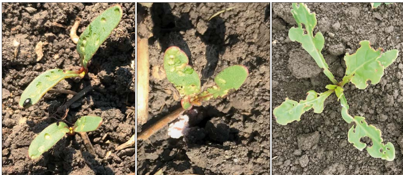
Obr. 1. Poškození vzházejících rostlin cukrové řepy dřepčičky při použití osiva mořeného tefluthrinem

Insekticidní moření osiva cukrové řepy je u nás v posledních dvaceti letech dvousložkové, sestává z fumigujícího pyretroidu ( tefluthrin nebo betacyfluthrin ) a systemického neonicotinoidu ( imidacloprid nebo thiometoxam či clothianidin ). Je to velmi osvědčená kombinace insekticidních účinných látek. Pyretroidní