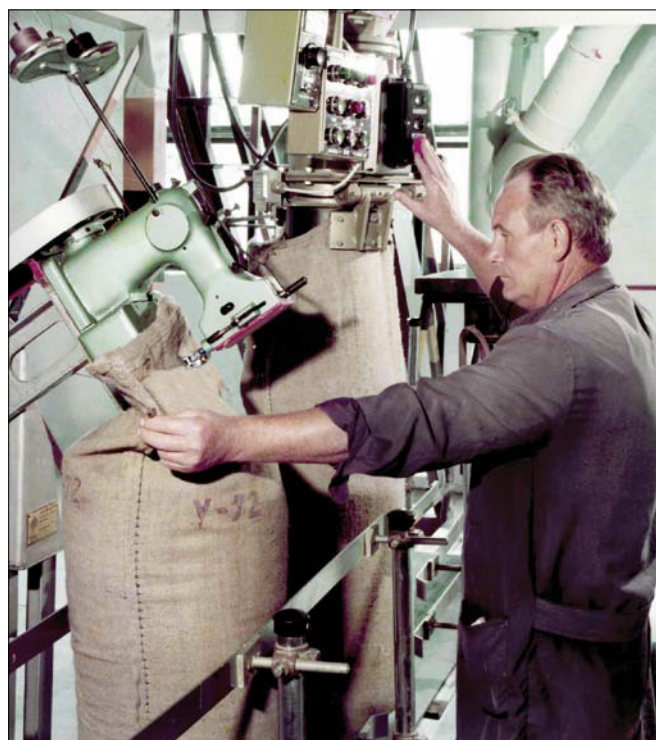
Obr. 3. Plnění pytlů cukrem (80. léta)

Key words: sugar industry, political changes, Soviet Union, Czechoslovakia, development after World War II.