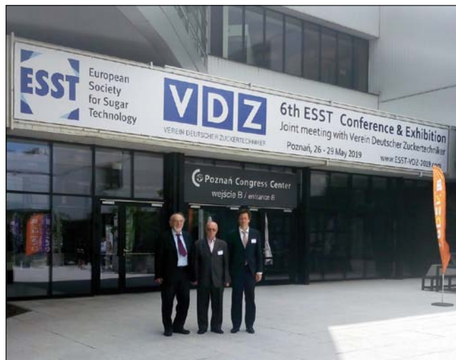
Obr. 1. Před kongresovým centrem v Poznani