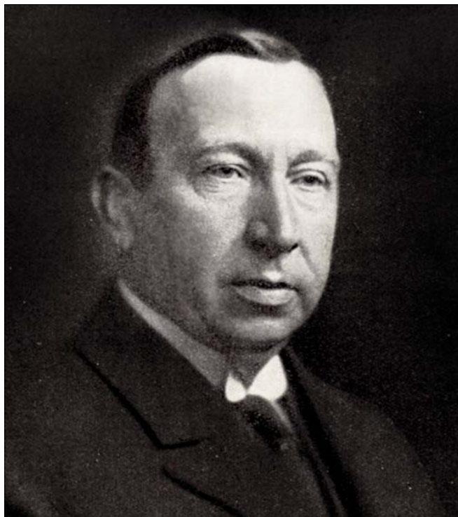
Pramen (5), s. 39

šlo o první (1912) a druhou (1913) balkánskou válku. V důsledku uvedených událostí byl v zemi nedostatek surovin, výrazně ztížena byla rovněž železniční doprava, která byla vyhrazena v zásadě jen pro vojenské účely. Všeobecná mobilizace pak s sebou nesla rovněž nedostatek pracovních sil, protože prakticky všichni (boje)schopní muži byli odvedeni. Navzdory všem okolnostem a komplikacím stavba podniku pokračovala. Takřka před dokončením ovšem celý region včetně cukrovaru 15. 6. 1913 postihlo zemětřesení, jedno z největších v historii moderního Bulharska. Většina zařízení podniku byla zničena, zahynulo 16 osob (9). Vedení podniku se však podařilo získat od Pražské úvěrní banky další úvěr. Díky těmto financím se podnik ze zkázy poměrně rychle zotavil, takže výsledky první kampaně 1913/1914 byly – i přes značné obtíže způsobené neproškoleným personálem a špatnou kvalitou cukrové řepy – nečekaně dobré. Zpracováno bylo celkem 31 159 t řepy, z níž bylo vyrobeno 2 960 t bílého cukru (8).