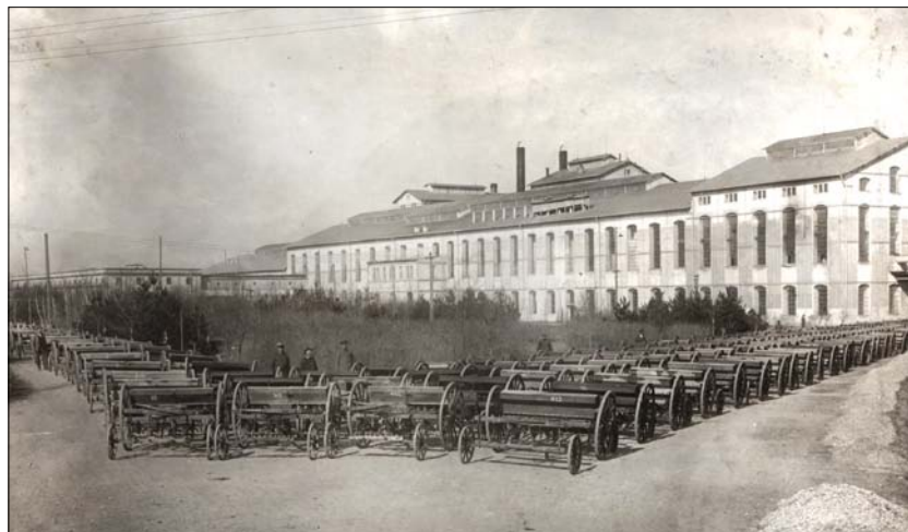
Obr. 3. Stroje na setí řepy, v pozadí cukrovar