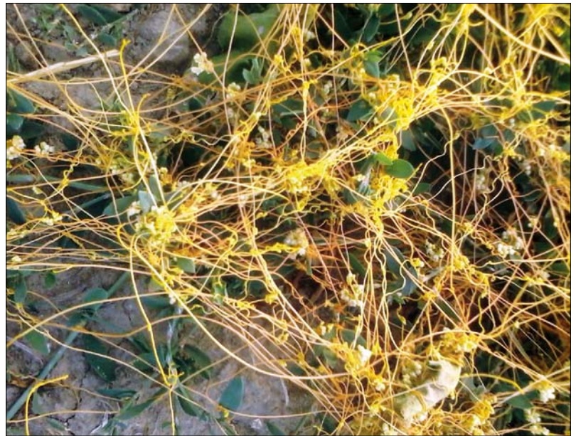
Obr. 2. Květy rostliny kokotice v malých shlucích podél stonků

umožnil rovnoměrné náhodné rozložení polí s cukrovou řepou i blízkých pozemků v rámci sledovaných oblastí (podobný půdní typ a prvky krajiny). Pozorování byla prováděna od června do září za plné vegetace a na všech plochách, kde byla potvrzena přítomnost kokotice, byly zaznamenány souřadnice GPS a odpovídající nadmořská výška. Na každém pozemku (celkově 174 lokalit v obou letech) byla přítomnost kokotice odhadnuta použitím Daubenmirovoy stupnice (15). Ta spočívá ve vizuálním odhadu jedné ze šesti tříd pokrytí s následujícím rozsahem: 1 (≤5%), 2 (5–25 %), 3 (25–50 %), 4 (50–75 %), 5 (75–95 %), 6 (95–100 %). Intenzita napadení byla rozdělena do tří kategorií: