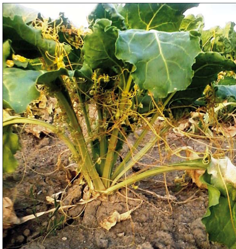
Obr. 1. Kokotice plní parazitující v cukrové řepě

Kokotice roste okolo 7 cm za den, a tak může v období růstu jedna rostlina pokrýt až 3 m 2 (1). Může se také rozšířit a napadnout další hostitelské rostliny, jsou-li v blízkosti, často pak tváří hustou vláknitou masu. Kvetení nastává od pozdního jara až do podzimu v závislosti na druhu a stanovišti. Květy jsou početné, úzké, bělavé až narůžovělé (obr. 2.). Vytvářejí kulovitá květenství okolo stonku. Plodem jsou malé kulovité tobolky se 2–4 semeny. Semena kokotice jsou sféroidního tvaru, většinou 0,5–1 mm v průměru. Mají tvrdé, pevné osemení, v závislosti na druhu se může lišit tloušťkou. Semena jsou schopna přežít v půdě přes dvacet let. K narušení obalu semene