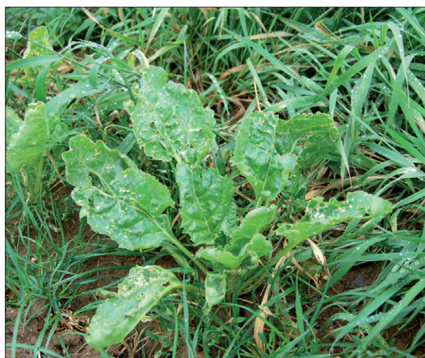
Obr. 2. Nevládnutá ochrana proti plevelům působí problémy