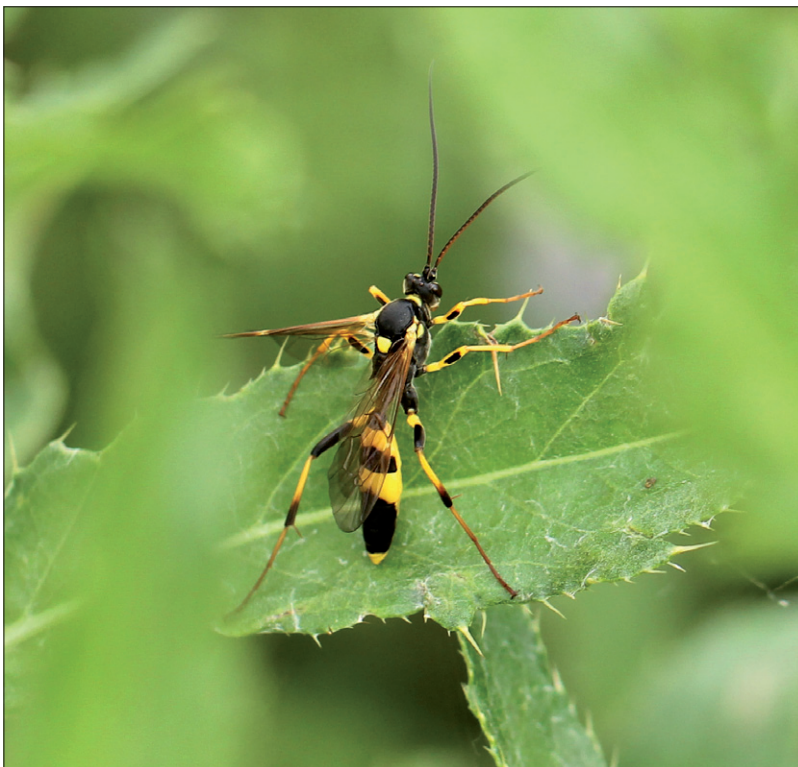
Obr. 1. Samec lumka Amblyteles armatorius

Velmi často se ovšem škůdce odhalí až podle příznaků poškození v pozdější době. Tady pak účinnost ochrany těsně souvisí s místem žíru housenek a jejich životním cyklem. U druhů poškozujících listy je možné chybu rychle napravit aplikací insekticidu, neboť se postřiková jícna snadno dostane do styku s housenkou či částí konzumovaného listu. Nižší účinnost insekticidů je ovšem na druhy žijící uvnitř listových řapíků (zavíječ kukuřičný) nebo v srděčku (makadlovky). U druhů vyvíjejících se na podzemních částech bulvy (osenice, hrotnokřídleci) je účinnost minimální, neboť v současné době registrované přípravky se do místa výskytu housenek nedostanou.