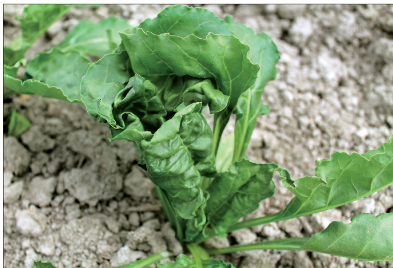
Obr. 9. Shluk listů cukrovky

Poděkování: Autoři článku děkují za spolupráci Ing. J. Migdauovi. Výzkum byl podpořen grantem MZe RO0417.