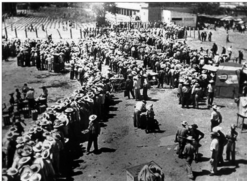
Obr. 1. Braceros v náborovém táboře