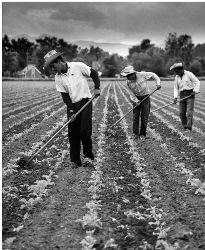
Obr. 3. Braceros na řepném poli v USA (1961)