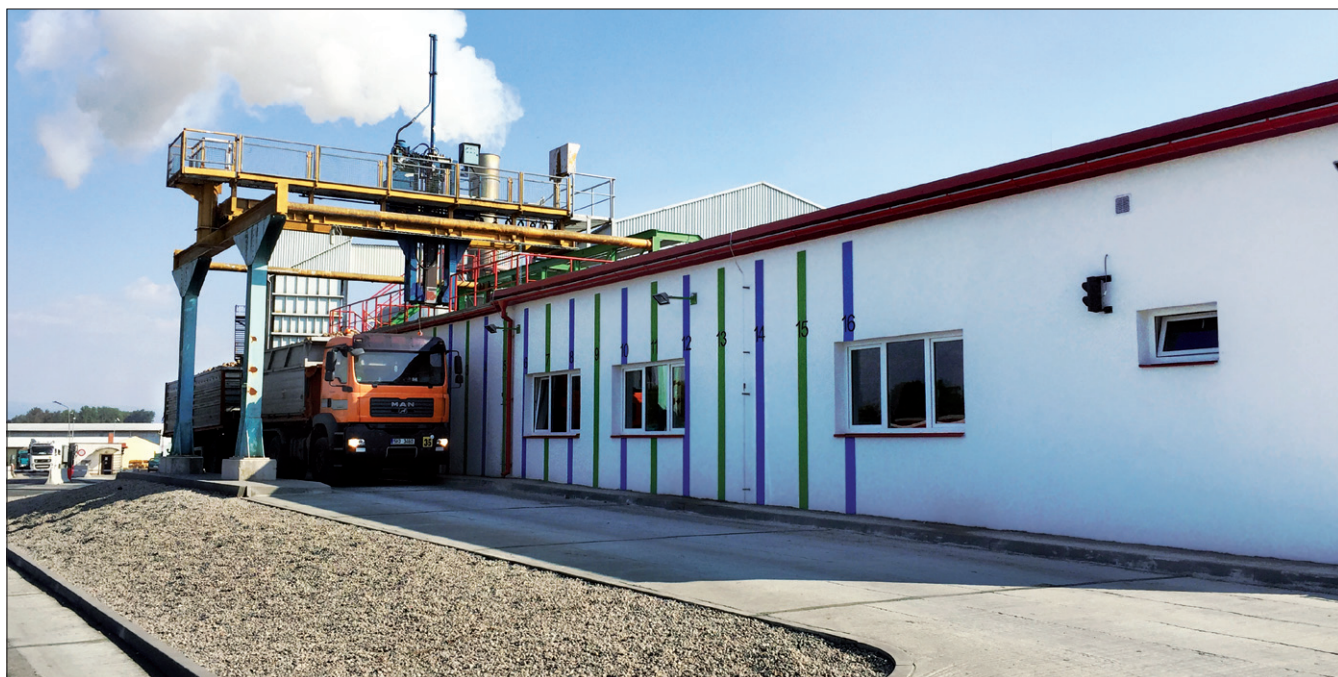
Obr. 3. Laboratoř výkupu cukrové řepy v českomeziříčském cukrovaru

V roce 2016 pak byla v Českém Meziříčí pro exaktní nákup vybudována nová laboratoř v hodnotě investice 30 mil. Kč (obr. 1.), v níž se současně uplatnily nově dohodnuté podmínky nákupu s mikroseřezem. To odpovídá obecnému trendu ve všech vyspělých cukrovarnických státech v Evropě, ve kterých se přechází z klasického provádění seřezu koruny řepy vykonávaného při výkupu na systém výkupu s paušální srážkou za seřez při uplatňování minimálního seřezu sklizené řepy.