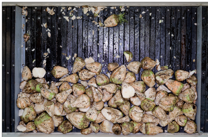
Obr. 3. Fotografie rozříděného vzorku dodávky na třídícím stole pro archivaci