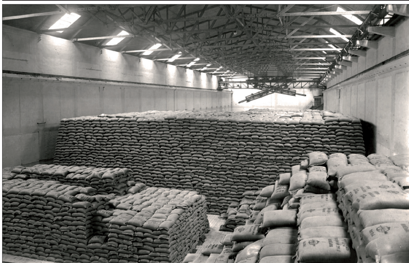
Skladiště rafinovaného cukru v cukrovaru Pražské cukerní společnosti, jednoho z předních exportérů cukru první republiky, v Mělníku