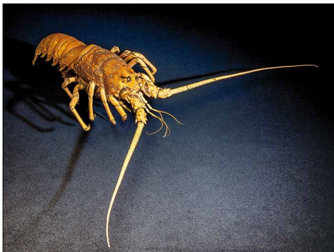
Obr. 2. Sacharidy jsou mj. i stavebními látkami schránek korýšů; tvoří je chitin, druhý nejrozšířenější polysacharid v přírodě

Základem expozice jsou rozsáhlé původní sbírky starého muzea zaměřené na historii produkce i užití řepného a třtinového cukru, včetně exponátů připomínajících německé cukrovarnické velikány Marggrafa a Acharda. Nezůstalo však jen u toho. Tvůrci expozice měli vyšší cíle. V dnešní době, kdy je veřejnost zaplavována nepravdami či polopravdami o cukru jako bílém jedu (u nás z poslední doby např. v příloze Blesku „Cukr zabiják“ v lednu) chtějí návštěvníky seznámit s tím, že cukr, respektive sacharidy se nacházejí v přírodě všude kolem nás (obr. 1.). Jsou nejrozšířenějšími organickými molekulami jako jedny ze základních přírodních látek v rostlinných i živočišných organismech, bez nich by nebyl život vůbec možný. Pro organismy jsou zdrojem i zásobou energie, tvoří těla rostlin i řady živočichů (obr. 2.) atd. Proto i svým názvem expozice veřejnosti připomíná, že náš svět je vlastně vytvořen z cukru! Sacharidy neslouží jen jako sladidla, jsou surovinami pro výrobu papíru, textilních vláken, výbušnin, léků a řady dalších produktů.