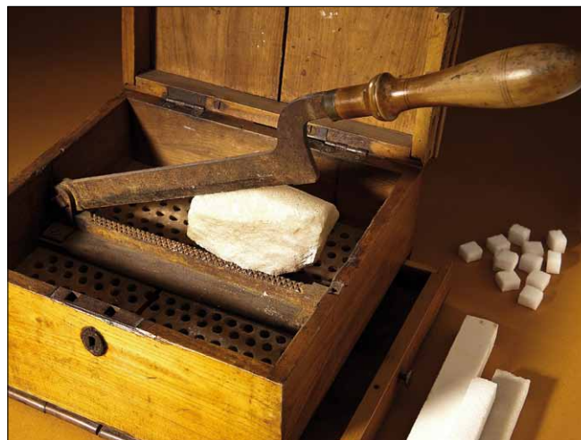
Obr. 3. Z expozice: uzamykatelná schránka na cukr z jilmového dřeva se sekáčkem cukru z homolí; 18. století