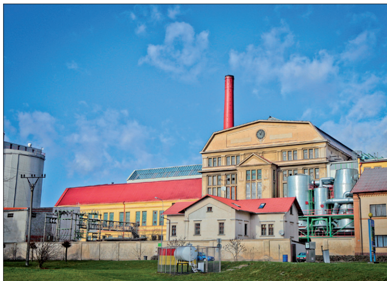
Obr. 6. Čelní pohled na českomeziříčský cukrovar

a východní Evropě dodává na český trh biopalivo E85. V roce 2015 bylo toto palivo k dostání na více než 300 čerpacích stanicích. Roční výrobní kapacita lihovaru, která je jeden milion hektolitřů, činí z tohoto závodu největší průmyslový lihovar v České republice a nejmodernější lihovar ve střední a východní Evropě.