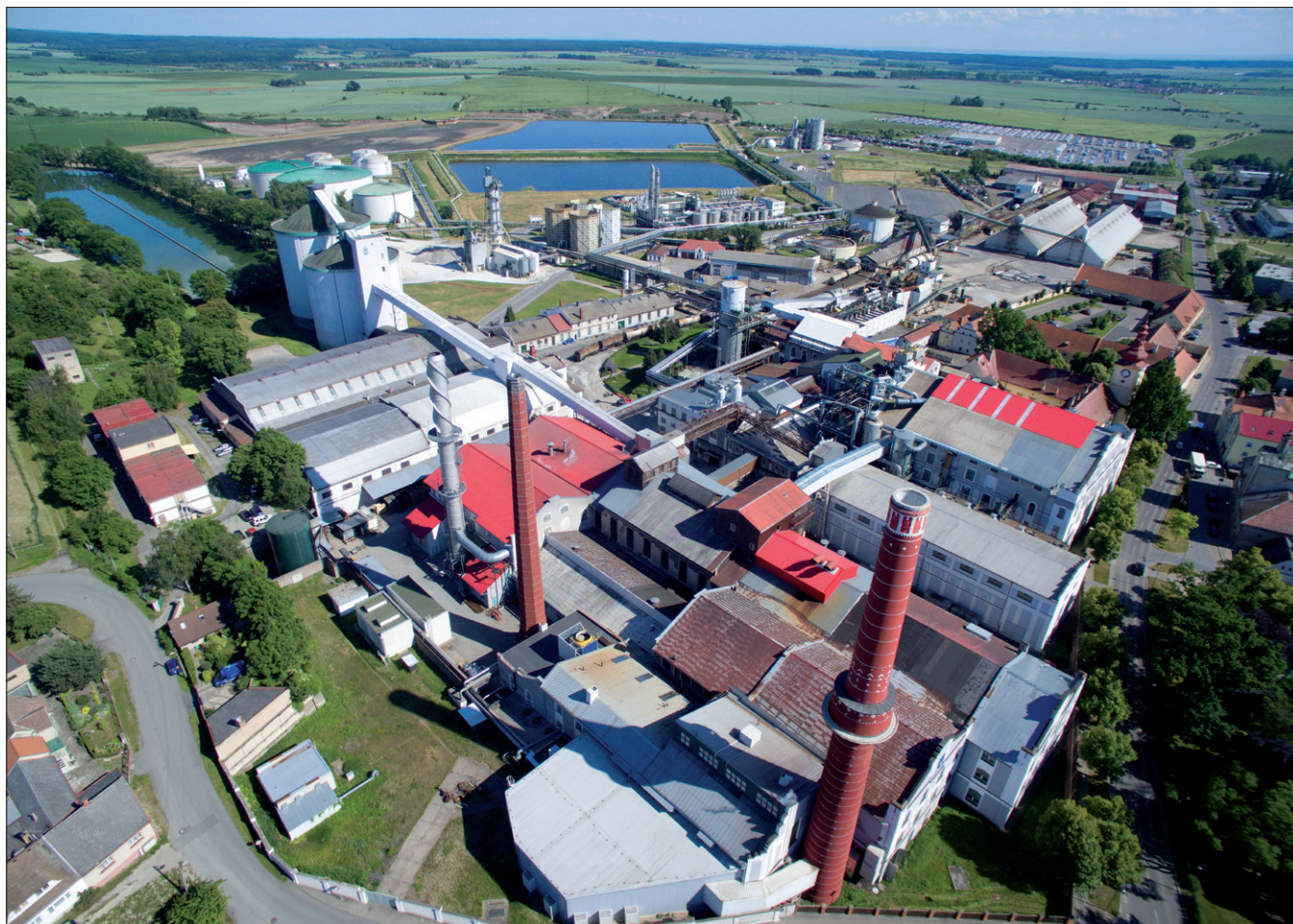
Obr. 1. Pohled na cukrovar a lihovar Dobruvice od dobrovického náměstí

V držení Thurn-Taxisů byl cukrovar 92 let, následně několikrát změnil majitele, když ho vlastnili jak soukromí akcionáři, tak stát. V roce 1992 pak do Dobruvice vstoupili francouzští akcionáři, v té době malá cukrovarnická společnost Union SDA z regionu Pikardie. Union SDA nebyl v té době žádný gigant, ale družstevní společnost tradičních a dlouholetých pěstitelů