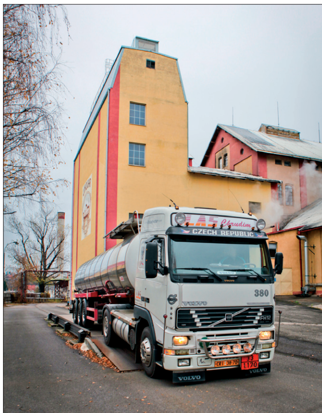
Obr. 7. Cisterna opouští areál lihovaru v Chrudimi a míří plná vysoce kvalitního líhu k jednomu ze zákazníků

zajištěna dlouhodobými kontrakty s více než 500 pěstiteli. Neustále roste portfolio zákazníků v ČR a EU, cukr je exportován také do třetích zemí. Společnost vedle cukru a pitného líhu vyrábí úspěšně obnovitelné zdroje energie, kdy je naplno využíván výjimečný potenciál cukrové řepy. Pěstování řepy, výroba cukru, líhu i obnovitelné energie je trvale udržitelná. Doufejme, že díky těmto skutečnostem továrny Tereos TTD napíší ještě dlouhou historii.