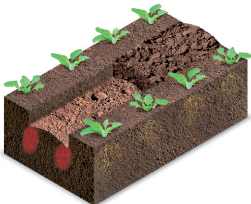
Obr. 2. Na profilu zpracovaného pásu půdy je patrné dno vytvarované do hrůbku; tato varianta je nejvhodnější

rozteč řádků, např. pro kypření zeleniny nebo některých technických plodin. Nosný rám stroje je navržen tak, že jsme ve výrobě schopni akceptovat takřka jakékoliv požadavky na řádkovou rozteč pracovních jednotek. Tím se zvýší podstatně využití stroje v podniku, minimálně pro kultivaci cukrovky a kukuřice.