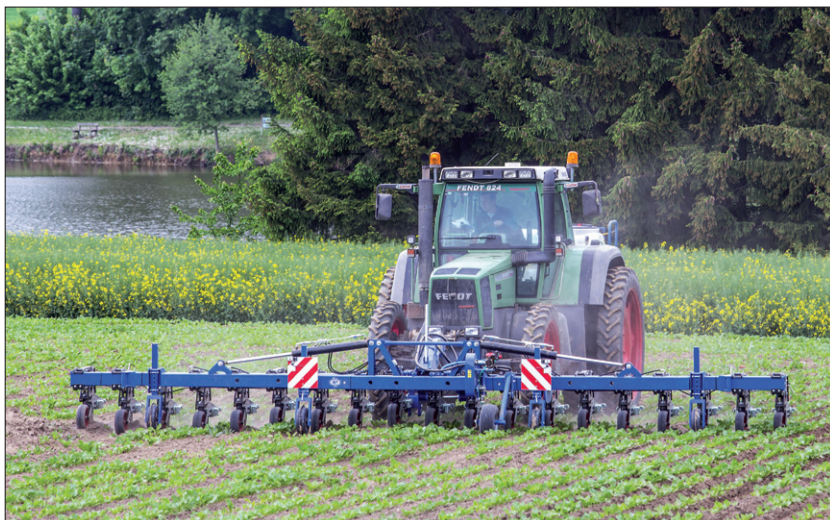
Obr. 1. Meziřádkový kypřič MeKy v čelním provedení se velice snadno „vede“ v řádcích a obsluha má celý proces pod kontrolou i bez jakéhokoliv složitého navigačního systému

Přijdou-li větší srážky, drážky na okrajích mají podstatně větší retenční schopnost zachytit vodu a tím redukovat vodní erozi. Pokud je naopak srážek málo, tvar dna brázdičky svede vodu ke stranám do žlábků, tedy ke kořenům rostlin a tam, kde je uloženo hnojivo. Struktura půdy na povrchu je podstatně hrubší, než je tomu u klasických šípových radliček. To má také vliv na omezení eroze. Hnojivo v tomto případě penetruje do půdy rychleji v elipsoidním tvaru směrem ke kořenům rostlin.