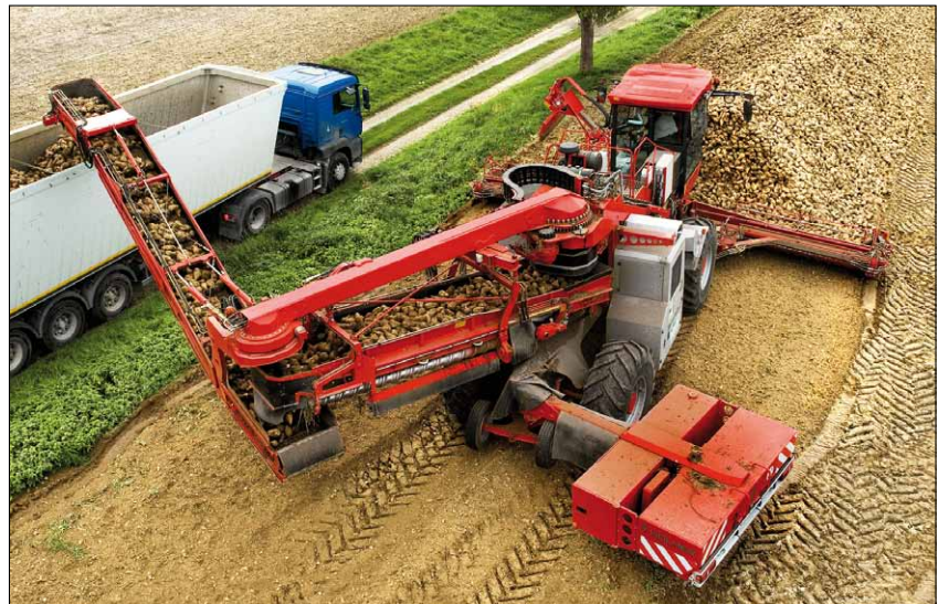
Obr. 3. Terra Felis 2 eco – samojízdný čisticí a nakládací stroj firmy HOLMER

odpružená. Firma HOLMER svým zákazníkům poskytuje individuální servisní služby, 24hodinový servis a zaslání náhradních dílů v průběhu řepné kampaně i rozsáhlý program školení.