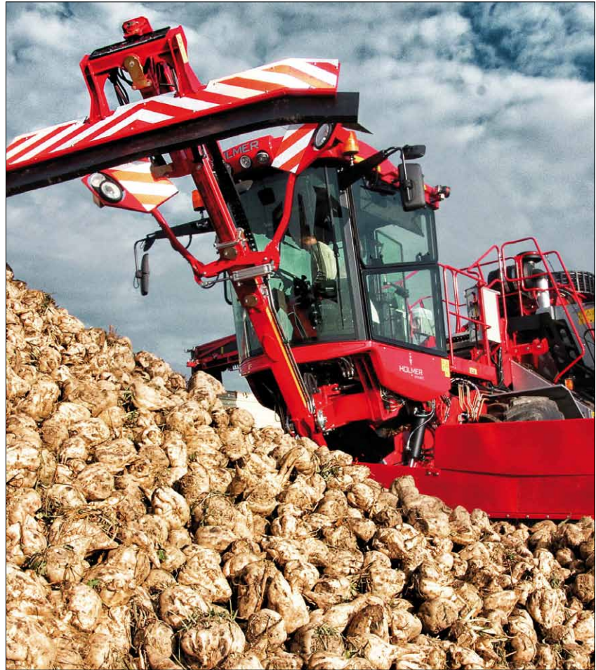
Obr. 2. Terra Felis 2 eco disponuje největší kabinou na trhu

odpružená. Firma HOLMER svým zákazníkům poskytuje individuální servisní služby, 24hodinový servis a zaslání náhradních dílů v průběhu řepné kampaně i rozsáhlý program školení.