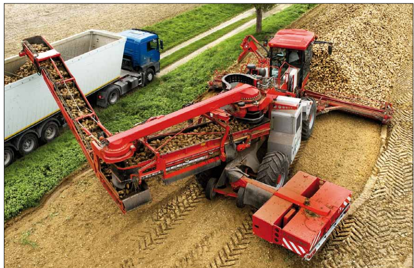
Obr. 3. Terra Felis 2 eco – samojízdný čisticí a nakládací stroj firmy HOLMER

odpružená. Firma HOLMER svým zákazníkům poskytuje individuální servisní služby, 24hodinový servis a zaslání náhradních dílů v průběhu řepné kampaně i rozsáhlý program školení.