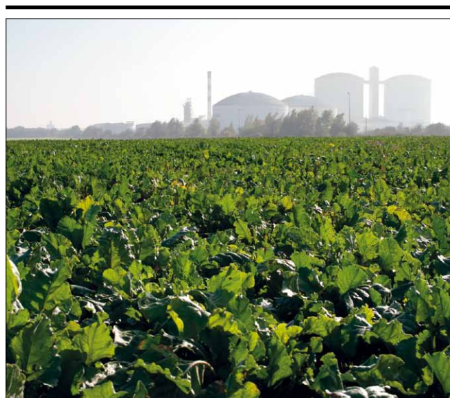
Cukrovar Connantre, Francie

oligopolu, či dokonce silného monopolu. Na trzích jednotlivých zemí EU operuje velmi omezený počet subjektů/společností. Určitou výjimku v tomto ohledu představují Francie, Německo, Polsko, Česká republika a Rumunsko, kde je počet subjektů,