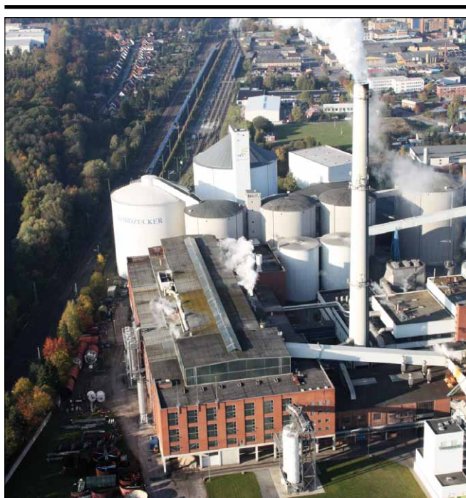
Cukrovar Uelzen, Německo

Tab. II. poskytuje přehled o situaci týkající se jednotlivých členských zemí EU z hlediska počtu funkčních řepných