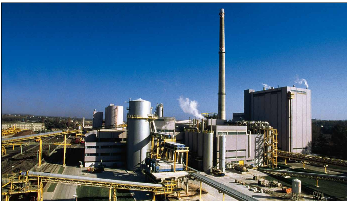
Cukrovar Zeitz, Německo