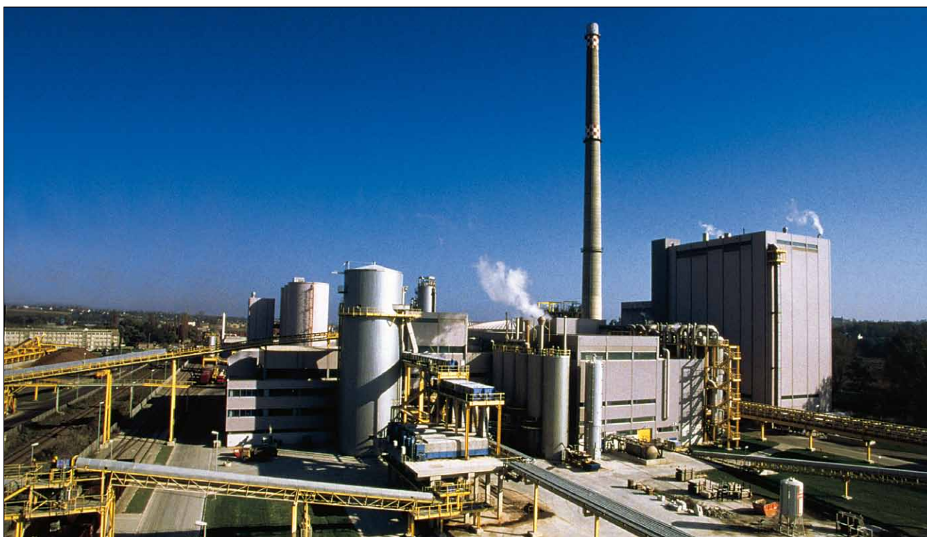
Cukrovar Zeitz, Německo