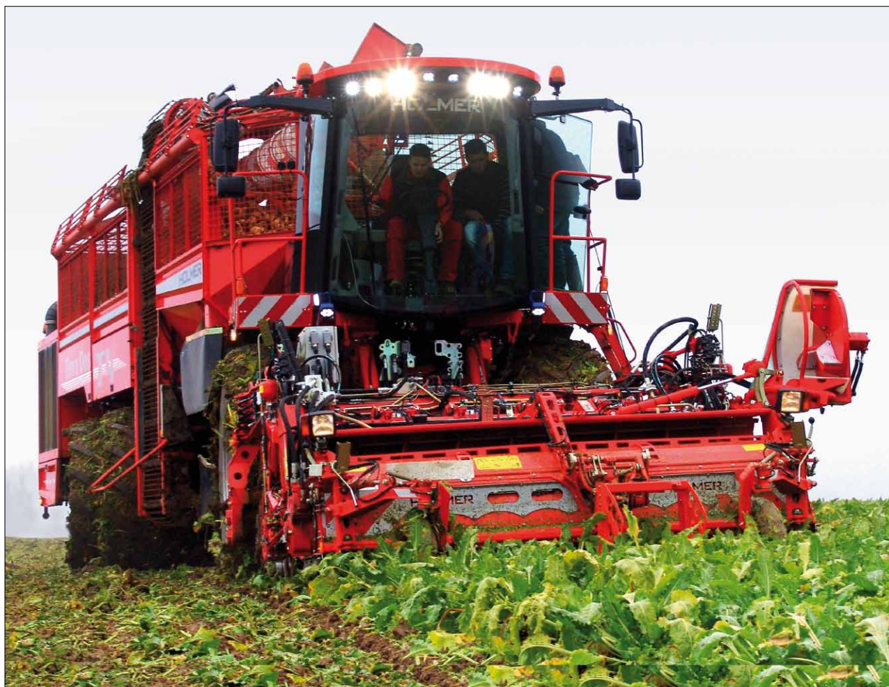
Obr. 1. Nový třínápravový vyorávač cukrové řepy Holmer Terra Dos T4-40

na 1 000 mm (tj. zvýšení o 12 % proti porovnatelnému třínápravovému řepnému kombajnu) dopravuje bulvy do zásobníku na více než 30 t cukrovky, který je vybaven elektronickou kontrolou stavu naplnění. Při vyprazdňování zásobníku se šetří čas využitím oboustranného plnění výložného pásu. Velkou předností při vyprazdňování zásobníku je rychlost a šetrnost příčných škrabákových podlah a výložného pásu zajištěná rovnoměrným vytížením řetězů i pásu. Terra Dos T4-40 tak dosahuje maximálně šetrného zacházení s řepou při nejvyšším možném průchozím výkonu.