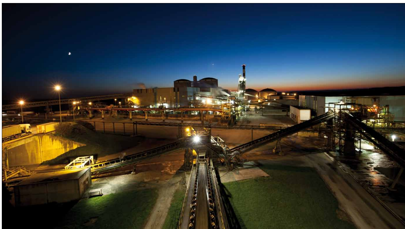
Noční pohled na francouzský cukrovar společnosti Tereos v Connantre