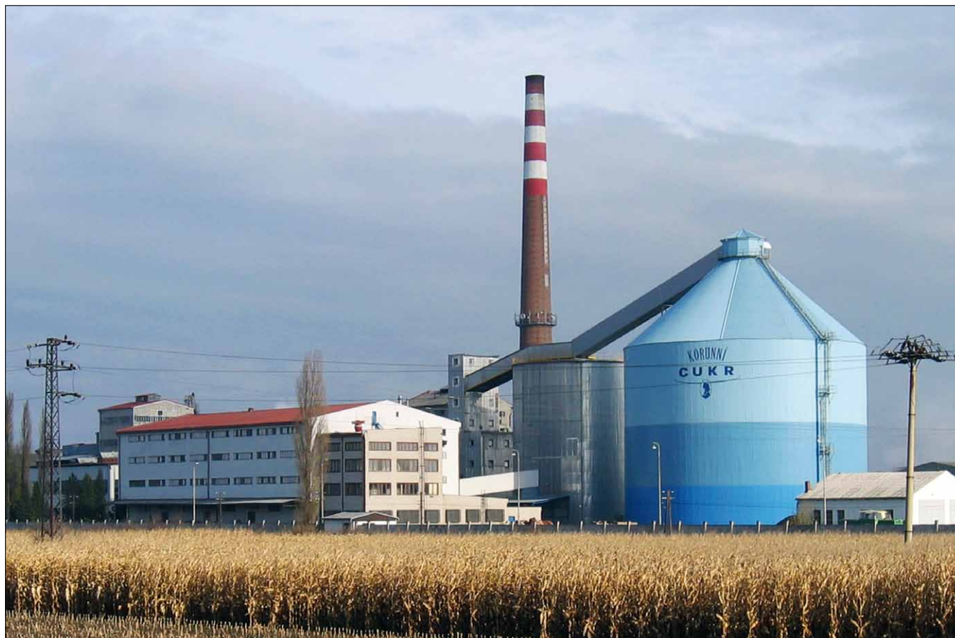
Obr. 11. Celkový pohled na cukrovar v Opavě-Vávrovicích v současné podobě (2004)

Mgr. Zdeněk Kravar, Ph. D., Zemský archiv v Opavě, oddělení pro správu fondů a sbírek, Sněmovní 1, 746 22 Opava, Česká republika, e-mail: z.kravar@zao.archives.cz