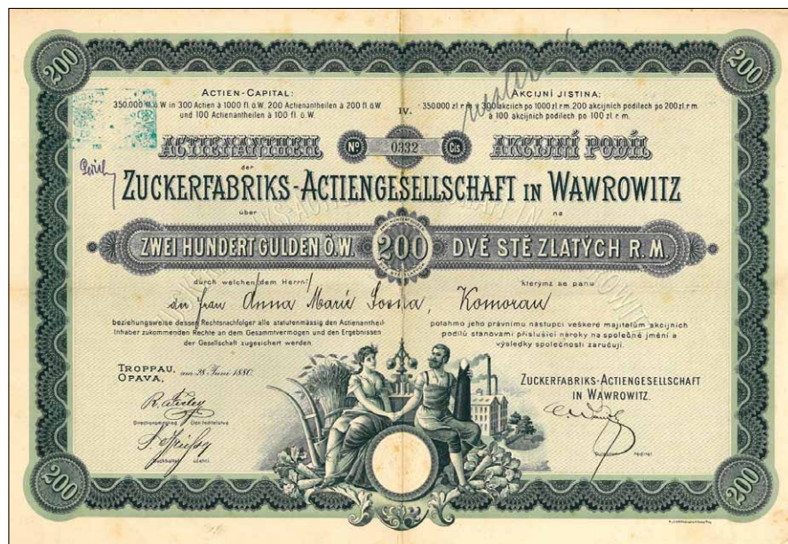
Obr. 1. Akcie „Zuckerfabriks – Actiengesellschaft in Wawrowitz“ z roku 1880