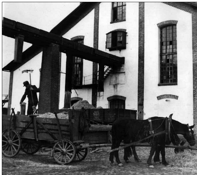
Obr. 4. Starý cukrovar – dopravník vyloužených řízků (1947)

vedení cukrovaru získávalo ze smének od obchodníků, kteří odebírali od firmy cukr. Když se krytí spotřební daně z dobroslavického statku ukázalo komplikované, uzavřela firma smlouvu s Agrobankou a ta zajišťovala krytí daňového úvěru. V roce 1905 se cukrovar spojil s českou bankou Union. Tento peněžní ústav obstarával až do poloviny 20. let prodej cukru v tuzemsku i v zahraničí a poskytoval firmě provozní úvěr.