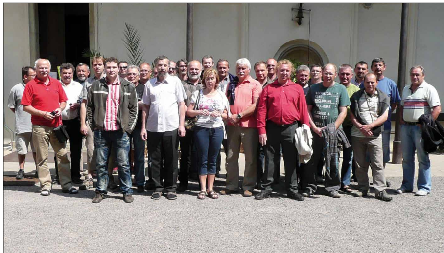
Obr. 1. Účastníci semináře u zámku ve Slatiňanech

Oběd absolvovalo všech 39 účastníků v příjemné restauraci U Vavřince v Ronově nad Doubravou. Poté následoval přesun kolony účastníků do hotelu Šenk ve Vápenném Podolu, místa konání vlastního školení.