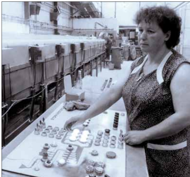
Obr. 13. Ovládací panel kostkárny Stork (1978–1980)

Cukr byl nakonec vyroben, ale celé odvětví zažívalo velké potíže s jeho odbytem z přeplněných skladů. Proto musela být asi na měsíc zastavena výroba drobného spotřebitelského balení. Za rok 1992 vykázal cukrovar hospodářskou ztrátu a jeho pohledávky u obchodních partnerů přesáhly 200 miliónů korun. Na výši ztráty se kromě zděděných závazků po státním podniku podepsalo i hospodaření obchodní firmy Sugar Olomouc. Ta realizovala prodej cukru ve státním podniku a do roku 1992 také prodej z cukrovaru Hrušovany. Od roku 1993 zajišťovalo