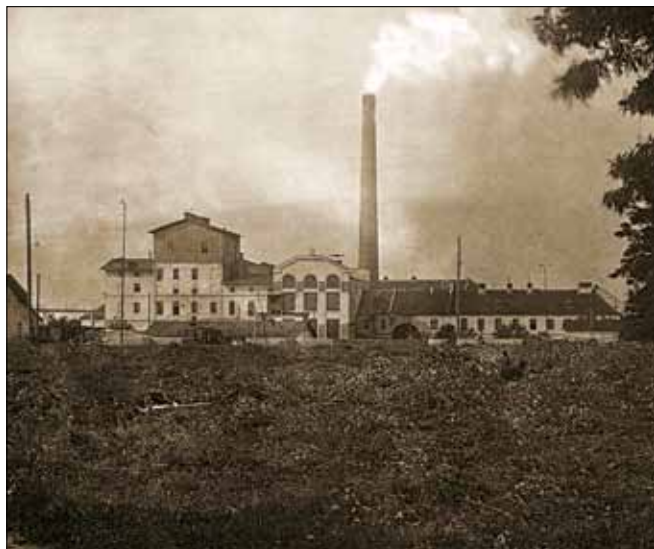
Obr. 6. Cukrovar od jihu