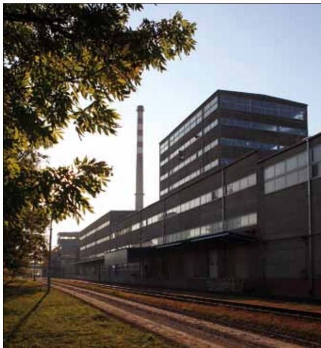
Obr. 14. Současná podoba hrušovanského cukrovaru

prodej hrušovanského cukru vlastní obchodní oddělení cukrovaru.