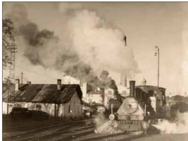
Obr. 7. Pohled na železniční vlečku cukrovaru

V roce 1925 cukrovar Hrušovany zpracoval 25 tis. t řepy. Přestože společnost již nesla dluh ve výši šesti milionů korun, došlo v roce 1926 k dalšímu rozšíření hrušovanské rafinerie.