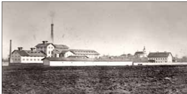
Obr. 1. Cukrovar v Hrochově Týnci po dokončení v roce 1871