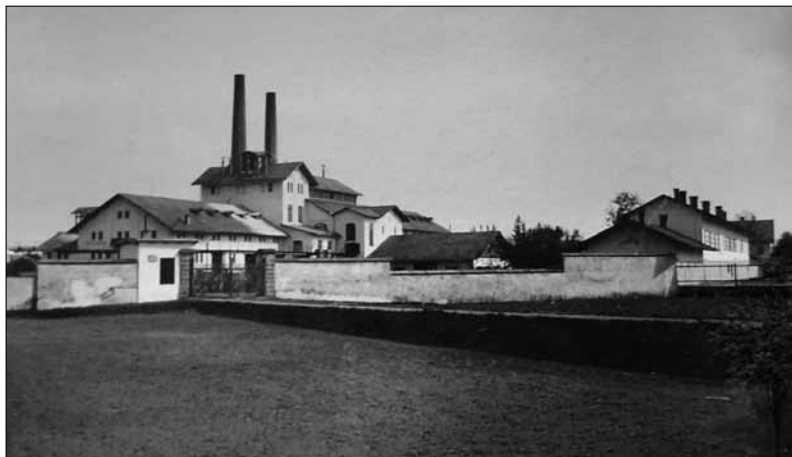
Obr. 2. Cukrovar ze severozápadu; v oplocení vrata železniční vlečky

V cukrovaru se používá parních strojů o celkovém výkonu 251 kW. Výrobu páry, potřebnou k pohonu těchto parních strojů, jakož i k ohřívání a sváření šťáv, zabezpečuje sedm Fairbairnových kotlů, tj. dvojplamencových kotlů s žárovými trubkami. Z těchto kotlů se tři (postavené firmou Märky, Bromovský & Schulz v roce 1903) používají k výrobě páry pro parní stroje. Z těchto kotlů se tři (postavené firmou Märky, Bromovský & Schulz v roce 1903) používají k výrobě páry pro parní stroje. Tři kotle s přetlakem 4,5 atm a plochou 172 m 2 (z roku 1882), vyrábějí páru pro vaření. Poslední kotel má plochu 220 m 2 , pracuje s tlakem 7 atm, pochází z roku 1898. Továrna je osvětlena svítiplynem, vyráběným z kamenného uhlí a parafinu.“