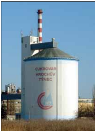
Obr. 2. Cukerní silo v Hrochově Týnci