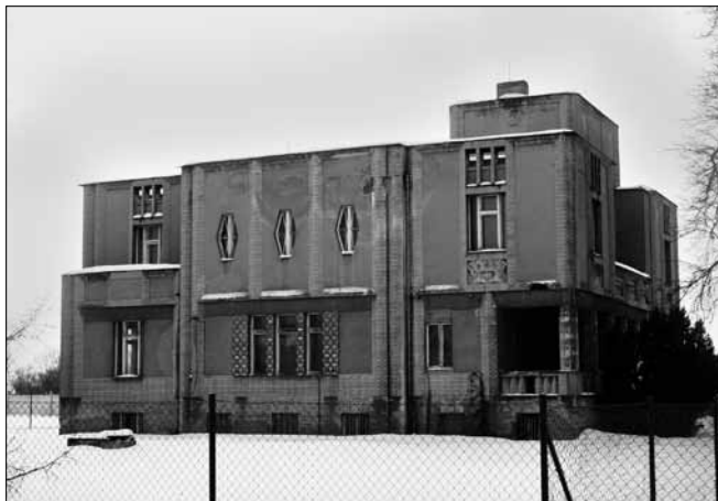
Obr. 2. Reprezentativní kubistická vila E. Králíčka, čp. 147