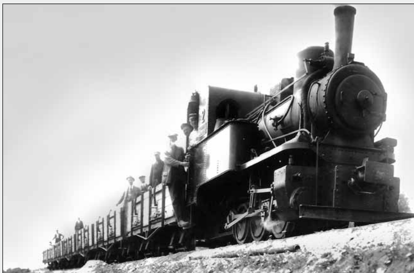
Fotografie z provozu na kopidlinské polní dráze