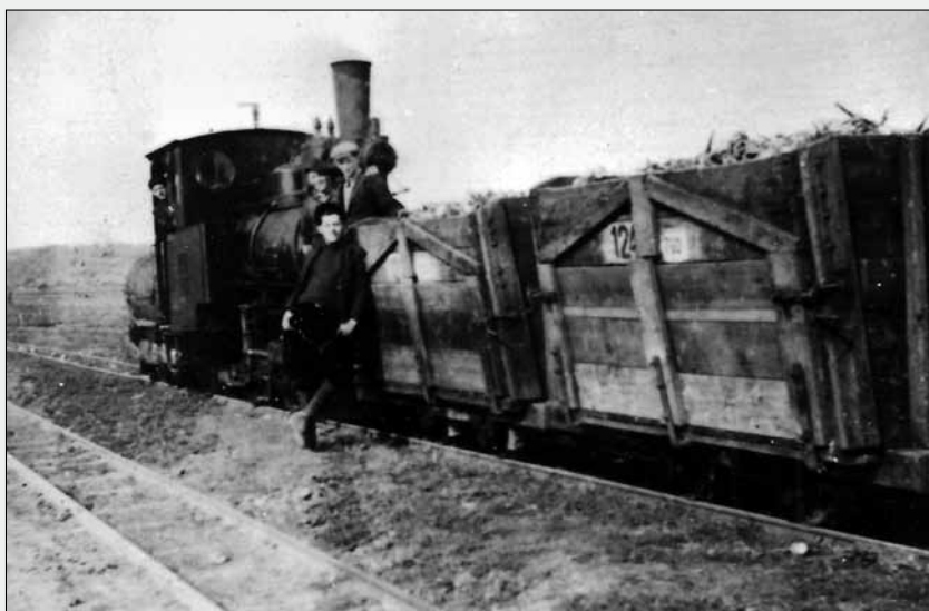
Doprava cukrové řepy na řepařské drážce cukrovaru Libněves (archiv J. Motyčky)