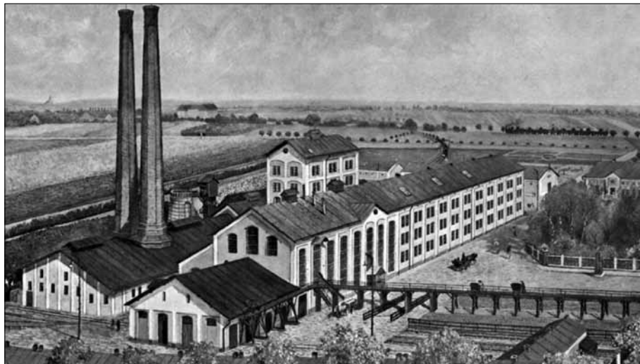
Obr. 2. Výřez z obrazu cukrovaru v Nymburce (kolem roku 1900) s vyobrazením železniční dopravy v okolí a mostní manipulační drahou v areálu závodu

byly staršího data, ale až aktivita a vliv velkopřemyslníka a majitele uhelných dolů na Ostravsku Davida Guttmanna, který vystavěl v Tovačově-Anníně cukrovar, dovedla myšlenku k realizaci. Stavba byla započata v dubnu 1894 pod hlavičkou Severní dráhy císaře Ferdinanda a lokální trať sloužila prakticky pouze nákladní dopravě (8).