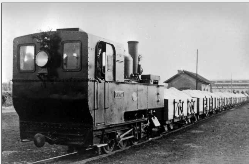
Lokomotiva „Ronov“ na Vítkavské úzkorozchodce převáží řepné řízky