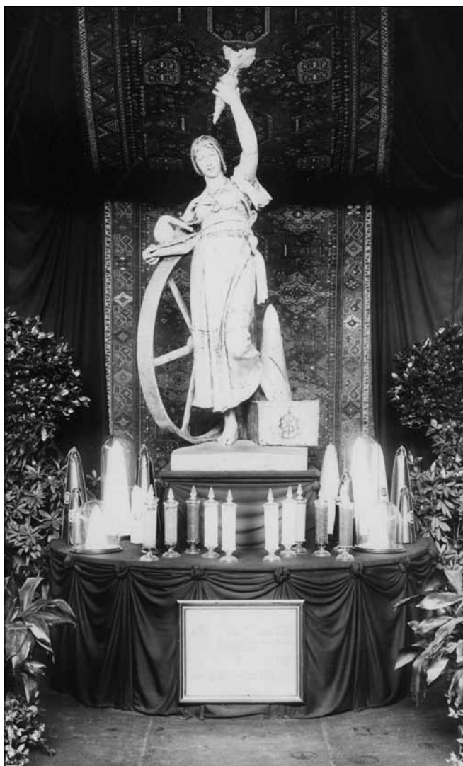
Obr. 1. Alegorie cukrovarnictví v cukrovarnickém pavilonu na Národopisné výstavě v Praze v roce 1895