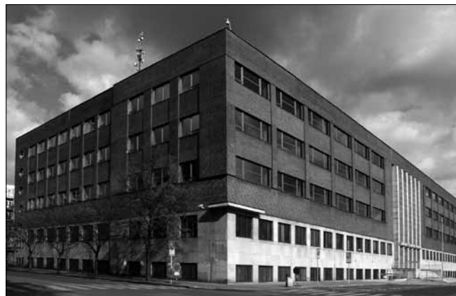
Obr. 3. Současná budova NTM na Letné

Na závěr tedy musíme konstatovat, že v nové budově muzea na Letné samostatná expozice cukrovarnictví nikdy nevznikla a ani není plánována. Předpokládá se však, že nové muzeum v Dobrušce splní dobře úlohu moderního informačního střediska o významu cukrovarnictví pro české země.