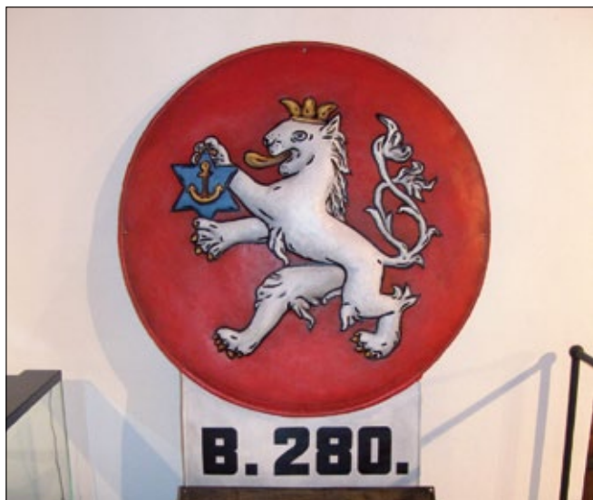
Obr. 20. Cedule se znakem cukrovaru v Praze-Modřanech

a tudíž také dokladem zručnosti, dovednosti a schopnosti zaměstnanců cukrovaru poradit si i v době nedostatku všech možných materiálů. Skluz na pytle byl v mělnickém cukrovaru používán pro dopravu pytlů s cukrem o hmotnosti 50 a 100 kg a byl umístěn v nábrežním skladišti cukru, které je dodnes v provozu především pro expedici cukru v drobném spotřebitelském balení. Stroje na manipulaci s cukrem doplňuje ještě mlýn na cukr pocházející z cukrovaru České Meziříčí. Mlýn patřil mezi doplňková strojní zařízení tzv. krystalovny. Vlastní mletí cukru se provádělo kladívkovým způsobem. Obecně byla v cukrovarech výroba mletého cukru zpočátku pouze doplňková, nezřídka se zpracovával odpad z výroby kostek a homolů. Postupně se však moučkový cukr v domácnostech rozšířil při přípravě a zdobení potravin. Strojní zařízení mlýnů patřilo mezi základní sortiment výroby zejména firmy Prokopec, později podniku TMS Pardubice (Továrny mlýnských strojů). Exponát je mladšího věku, poslední moučku umlel v roce 1998, patří však mezi typické a po desetiletí vyráběné stroje tohoto druhu.