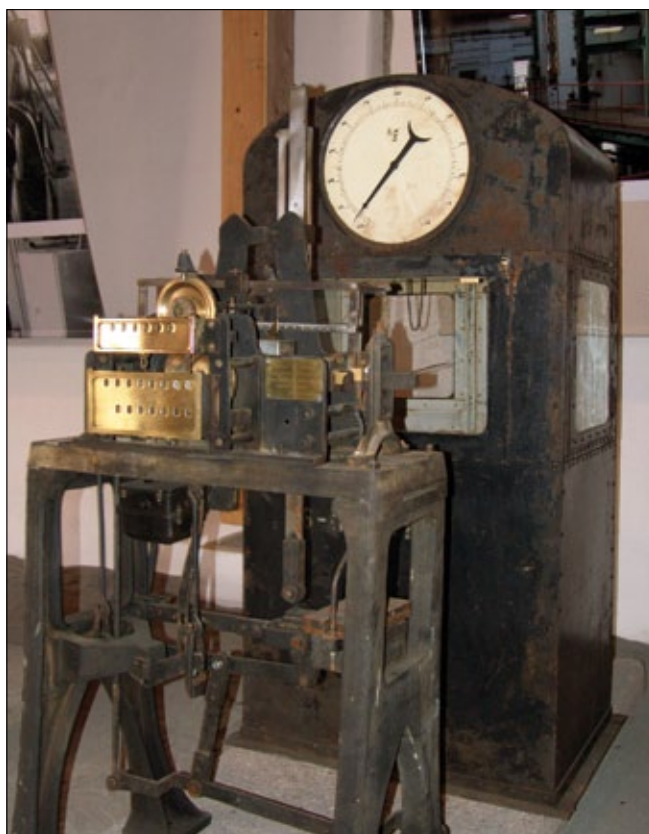
Obr. 19. Vagonetová váha firmy Wiesner Chrudim

ve Slatiňanech z doby kolem roku 1961. Tobogan na pytle s cukrem byl levným, rychlým a praktickým pomocníkem při vyskladňování cukru z vyšších pater cukerních skladišť. Zhromotňuje um a dovednost truhlářů, tesařů, mědikovců a potrubářů. Je sestaven z jednotlivých zvlášť opracovaných a sestavených dílů-prken, navléknutých na nosnou konstrukci, kterou je kovová roura. Stavební zabudování a umístění toboganu mezi patry cukerních púd dovolilo získat jen část z původní výšky, i tak je zachována jeho jedinečnost a tvar.