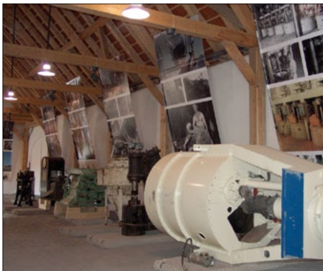
Obr. 17. Pohled do pavilonu M5, v popředí odstředivka ARO 1250