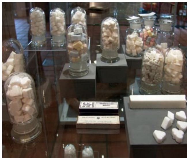
Obr. 7. Z expozice tvarovaných druhů cukru