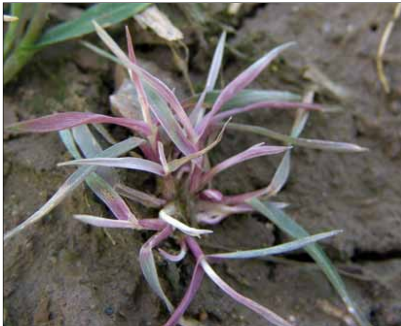
Obr. 7. Poškození PDS inhibitory ( diflufenican ) se u některých rostlin projevuje výrazným antokyanovým zabarvením (psárka polní)