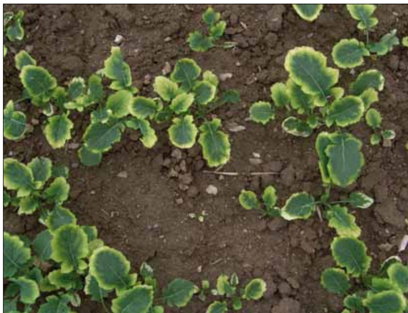
Obr. 8. K poškození řepky účinnou látkou clomazone (Command) dochází obvykle na lehčích půdách po intenzivních srážkách následujících po aplikaci – riziko poškození je větší při opožděném setí