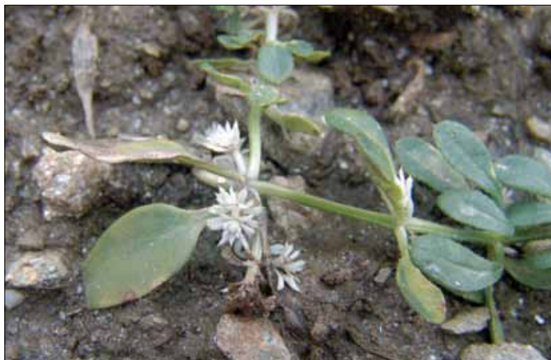
Obr. 6. Opožděná aplikace PDS inhibitorů ( diflufenican ) způsobuje u odolnějších druhů (svízel přítula) pouze poškození postraních výhonů, zatímco apikální část zůstává nezasážená

diflufenican (Cougar, Brodal) a beflubutamid (Herbaflex). Jde o půdní herbicidy (převažuje kořenový příjem), určené především pro preemergentní, resp. časnou postemergentní aplikaci v řadě plodin. Velmi důležité je proto hlubší setí, kterým se minimalizuje riziko fyto toxicity (obr. 5.). Herbicidy z této skupiny se vyznačují poměrně širokým spektrem působení (dvouděložné i trávovité plevele) včetně odolnějších druhů. Ošetření přerostlých plevelů (6 a více pravých listů) však vyvolává pouze dočasné vybělení a méně citlivé plevele často regenerují (obr. 6.). V rostlině jsou translokovány pouze xylémem. V půdě mají tyto herbicidy střední až dlouhou perzistenci, přičemž jsou rozkládány především mikrobiálně. Např. poločas rozpadu diflufenicanu je asi 14 dní, nicméně DT90, tedy doba za kterou proběhne 90% rozklad, je 228 dní (9).