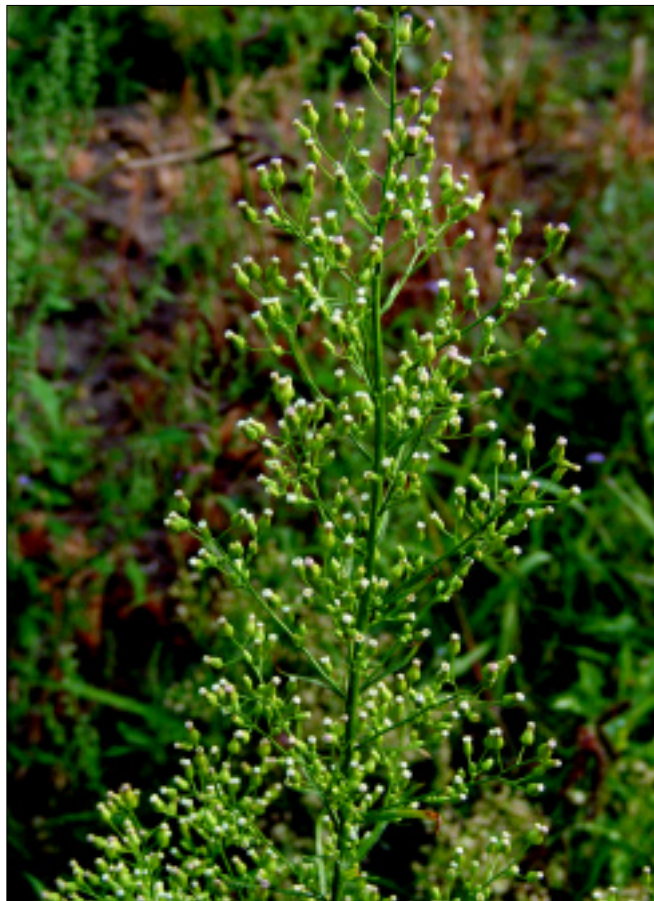
Obr. 1. Kvetoucí rostlina turanky kanadské

rostliny, které mohou i značně komplikovat mechanizovanou sklizeň.