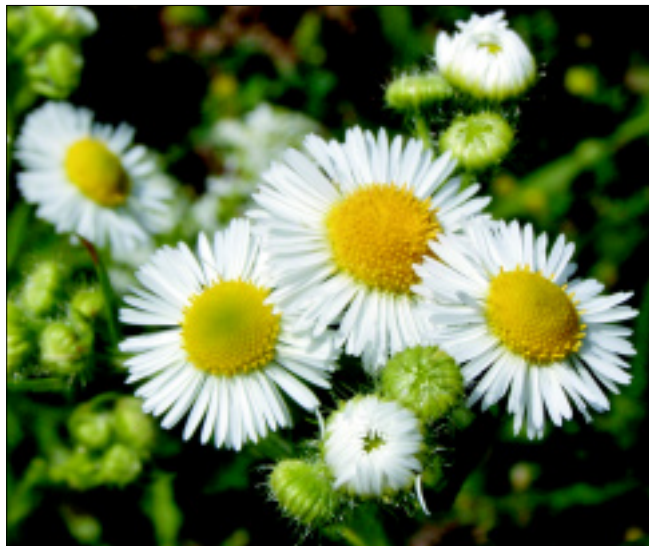
Obr. 5. Turan roční ( Erigeron annuum )