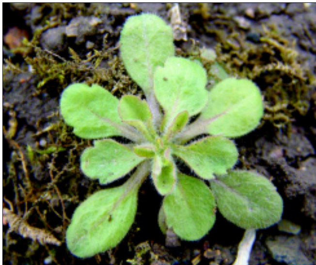
Obr. 4. Klíčící rostlina turanky kanadské

Turan roční je typickým druhem úhorů a pustých míst, jako plevel je častý ve školkách dřevin, nalézt jej však můžeme i ve víceletých pícninách. V jižnějších částech Evropy často na úhorrech dominuje. Velmi dobře snáší sucho, daří se mu tedy i na vysychavých, lehkých písčitých půdách, v teplejších oblastech státní je již poměrně hojný.